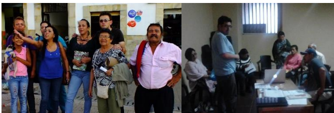
11 LA MESA. Septiembre de 2014. Fomento de la actividad productiva artesanal en Cundinamarca -UT Nexus Gestando, Artesanías de Colombia.