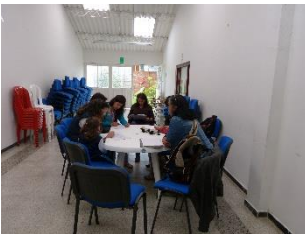
8 Socialización del proyecto en Chía, Sala de juntas Desarrollo Social. 09/10/2014. Proyecto: “Fomento a la actividad productiva artesanal del Departamento de Cundinamarca”. Operador: Nexus–Gestando. Artesanías de Colombia.