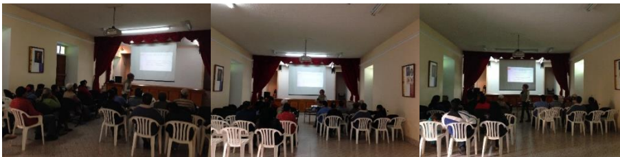
6 Socialización del proyecto (Cucunubá. Septiembre 03/2014. Proyecto: “Fomento a la actividad productiva artesanal del Departamento de Cundinamarca”. Operador: Nexus – Gestando. Artesanías de Colombia)

17 artesanas socializadas, con conocimiento de los objetivos y contenidos del proyecto, de los tiempos y de los profesionales que acompañarán dicho proceso y, con conocimientos básicos de la diferencia entre producto artesanal y producto de arte manual.