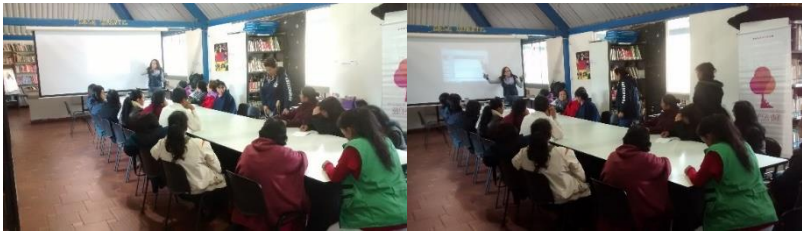
17 Socialización del proyecto y aplicación de encuesta (Ubaté. Septiembre 02/2014. Proyecto: “Fomento a la actividad productiva artesanal del Departamento de Cundinamarca” . Operador: Nexus - Gestando. Artesanías de Colombi

33 artesanas socializadas, con conocimiento de los objetivos y contenidos del proyecto y de los tiempos y de los profesionales que acompañarán dicho proceso.