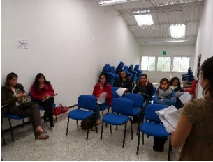
7 Socialización del proyecto en Chía, Sala de juntas Desarrollo Social. 09/02/2014. Proyecto: “Fomento a la actividad productiva artesanal del Departamento de Cundinamarca”. Operador: Nexus–Gestando. Artesanías de Colombia.