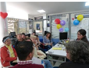
9 Socialización del proyecto en Chía, Oficina de Turismo. 09/26/2014. Proyecto: “Fomento a la actividad productiva artesanal del Departamento de Cundinamarca”. Operador: Nexus–Gestando. Artesanías de Colombia.