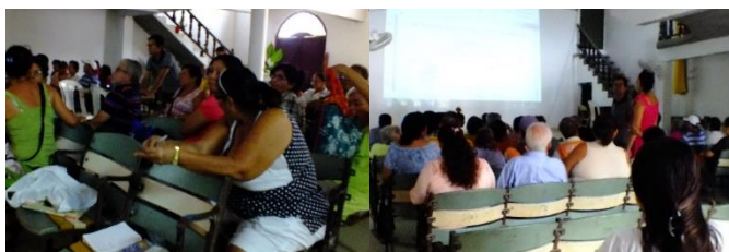
16 TOCAIMA, Septiembre de 2014. Fotografía: Nicolas Vergara - Fomento de la actividad productiva artesanal en Cundinamarca -UT Nexus Gestando, Artesanías de Colombia.

Se generan condiciones de espacio y recursos tecnológicos adecuados.