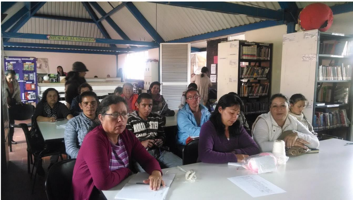
Charlas servicios bancarios, Ubaté 15 de octubre 2014 por Angela Salcedo