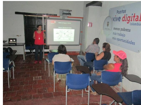
*Foto: Parque Principal local ArtePaz La Paz Guaduas. 2015