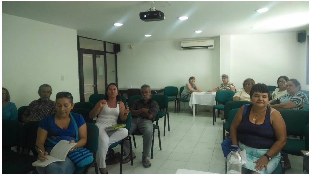
Conferencias sobre el RUT y la formalización, Girardot 16 de octubre 2014 por Angela Salcedo