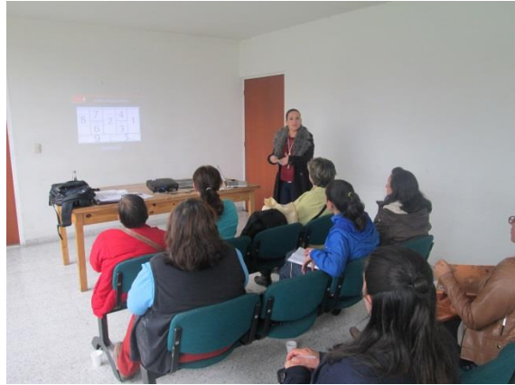
*Foto: Oficina desarrollo económico Facatativa. Fotos tomadas por Juan Mario Ortiz. 2015