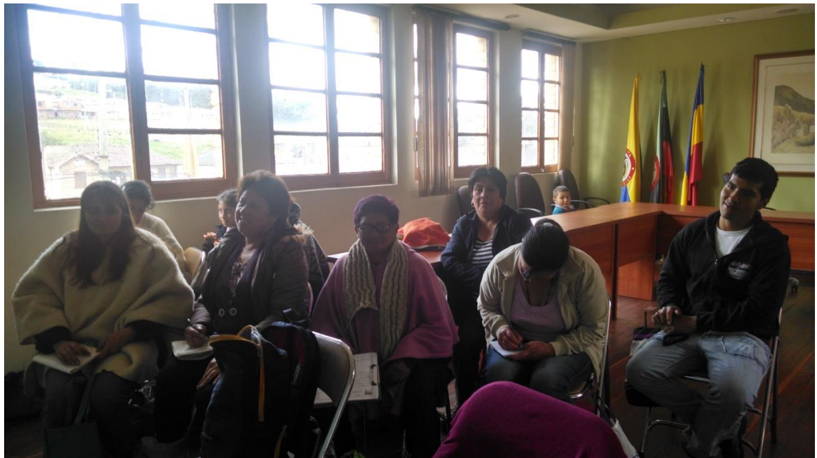
Charlas servicios bancarios, Tausa 14 de octubre 2014 por Angela Salcedo