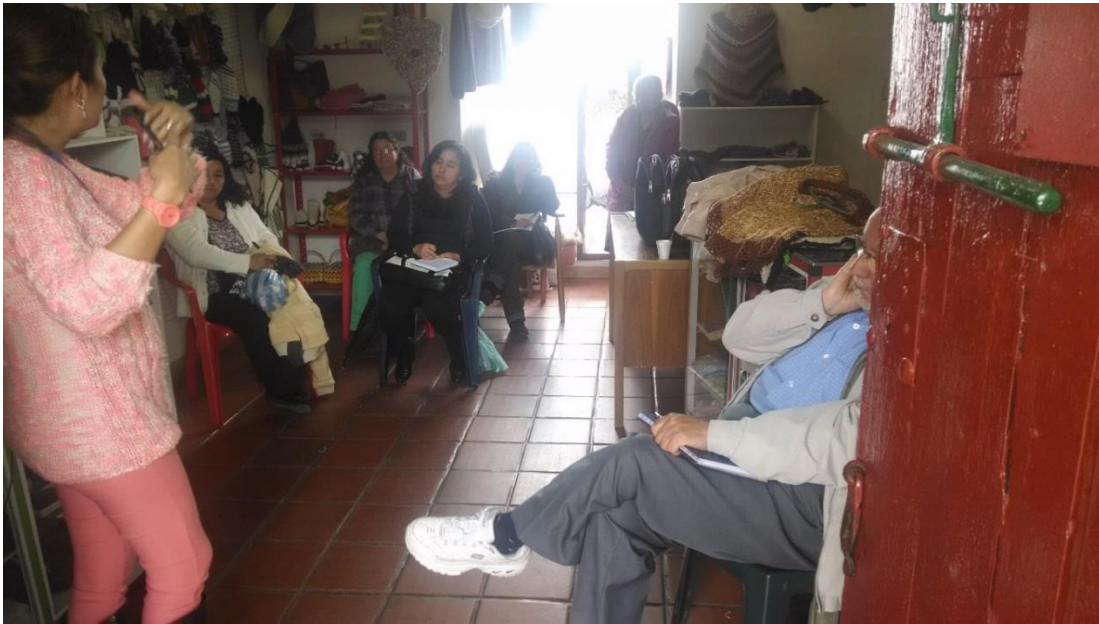
taller de administración de las unidades productivas, Cogua 9 noviembre 2014