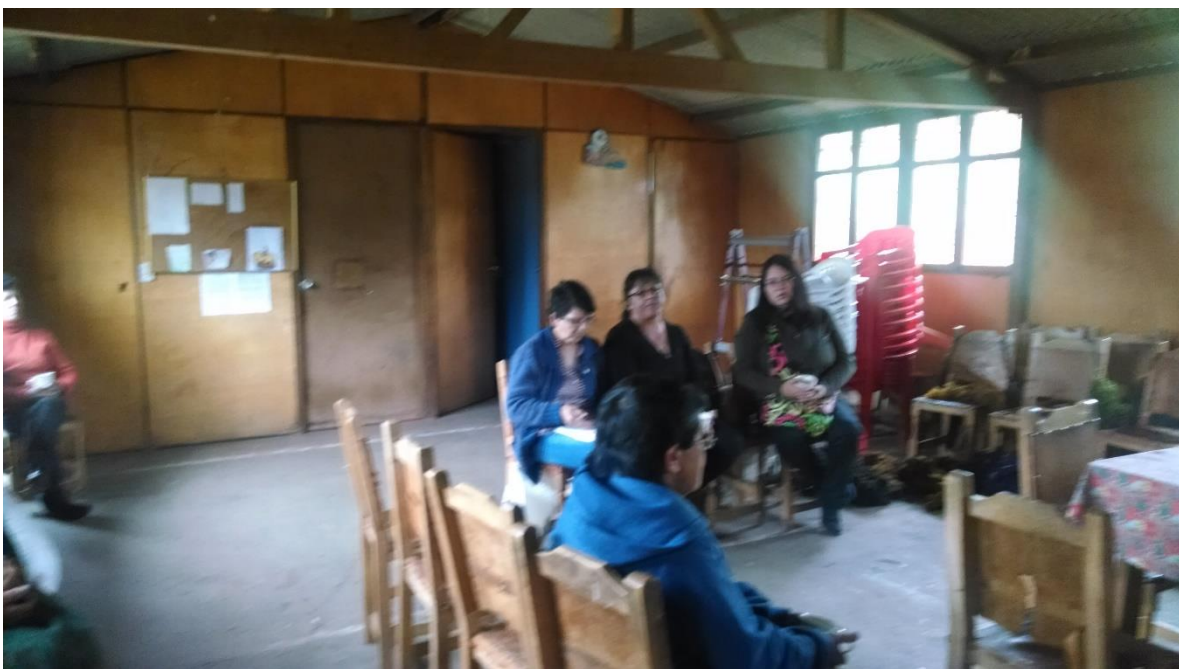
Fortalecimiento en Asociatividad, Sesquile 22 de octubre de 2014 por Angela Salcedo