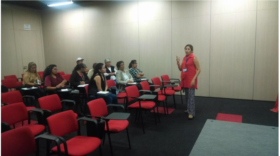
taller de administración de las unidades productivas, Fusagasuga 09 de noviembre 2014 por Angela Salcedo