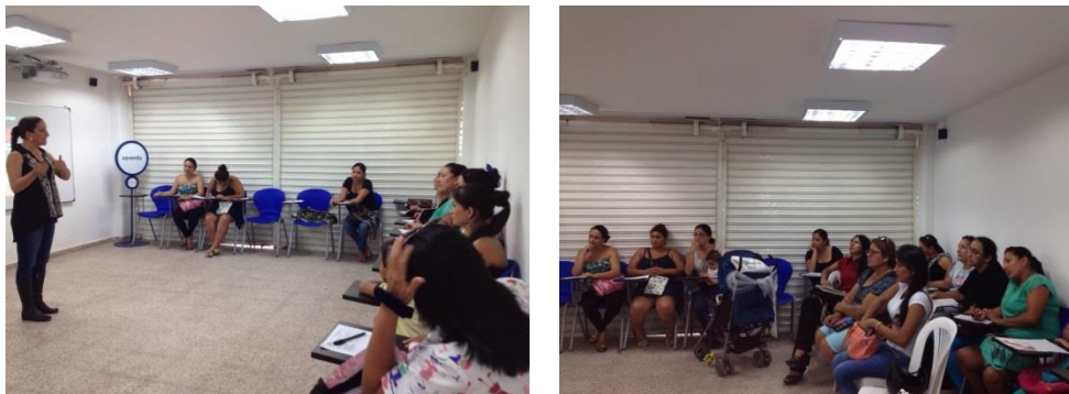
*Foto: Punto vive digital Ricaurte. Fotos tomadas por María Fernanda Carvajal. 2015

Ricaurte – Cundinamarca: 26 de Marzo del 2015