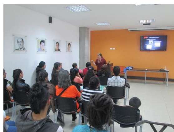
*Foto: Biblioteca Municipal Mosquera. Fotos tomadas por Juan Mario Ortiz. 2015