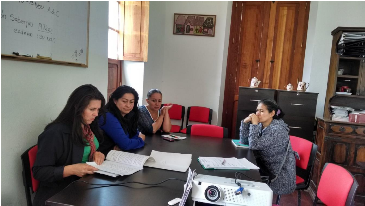
Fortalecimiento en Asociatividad, Cajicá 4 noviembre 2014 por Angela Salcedo