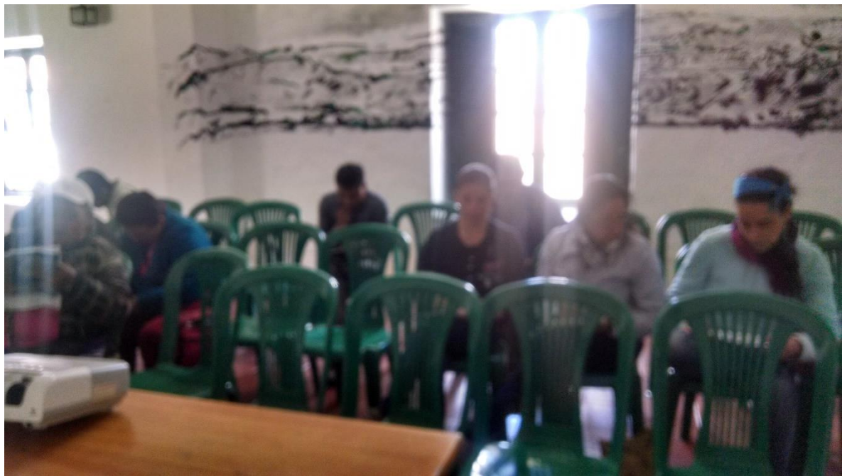
Conferencias sobre el RUT y la formalización, Suesca 23 de octubre 2014 por Angela Salcedo