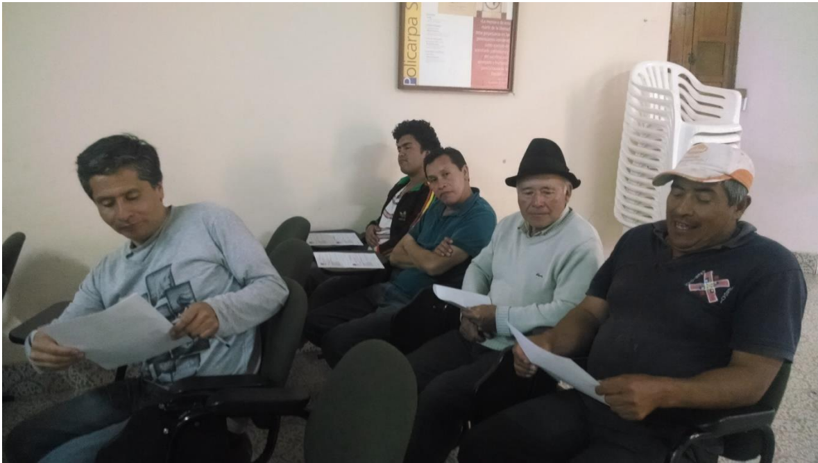
Fortalecimiento en Asociatividad, Cucunuba 05 noviembre 2014 por Angela Salcedo