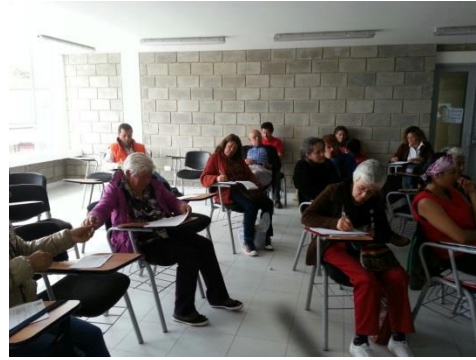
*Foto: Antiguo Colegio Policarpa Salabarieta Sopo. Fotos tomadas por Diego Carrillo. 2015