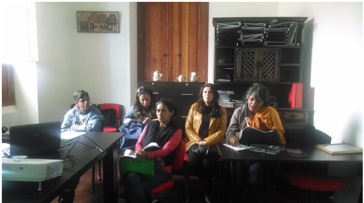
taller de administración de las unidades productivas, Cajica 21 de octubre 2014 por Angela Salcedo