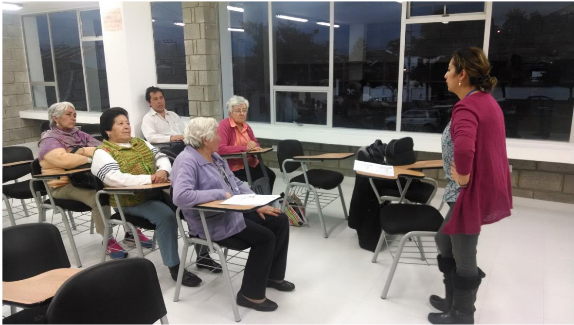
Conferencias sobre el RUT y la formalización, Sopo 24 de octubre 2014 por Angela Salcedo