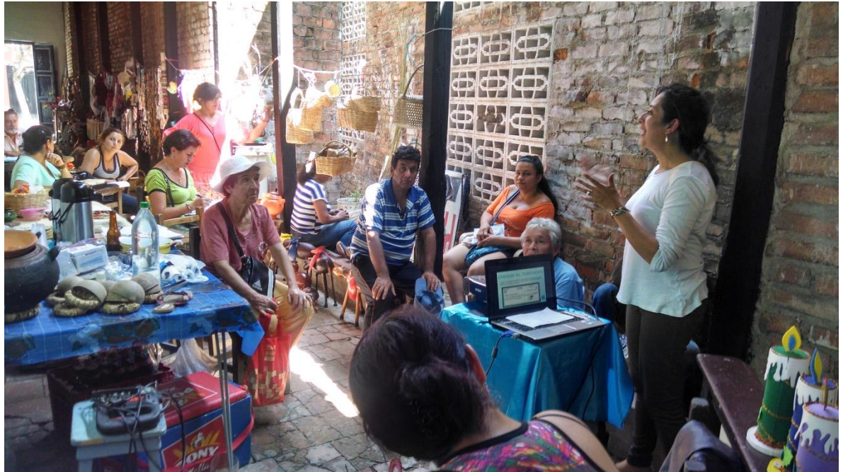
Charlas servicios bancarios, Tocaima 28 de octubre de 2014 por Angela Salcedo