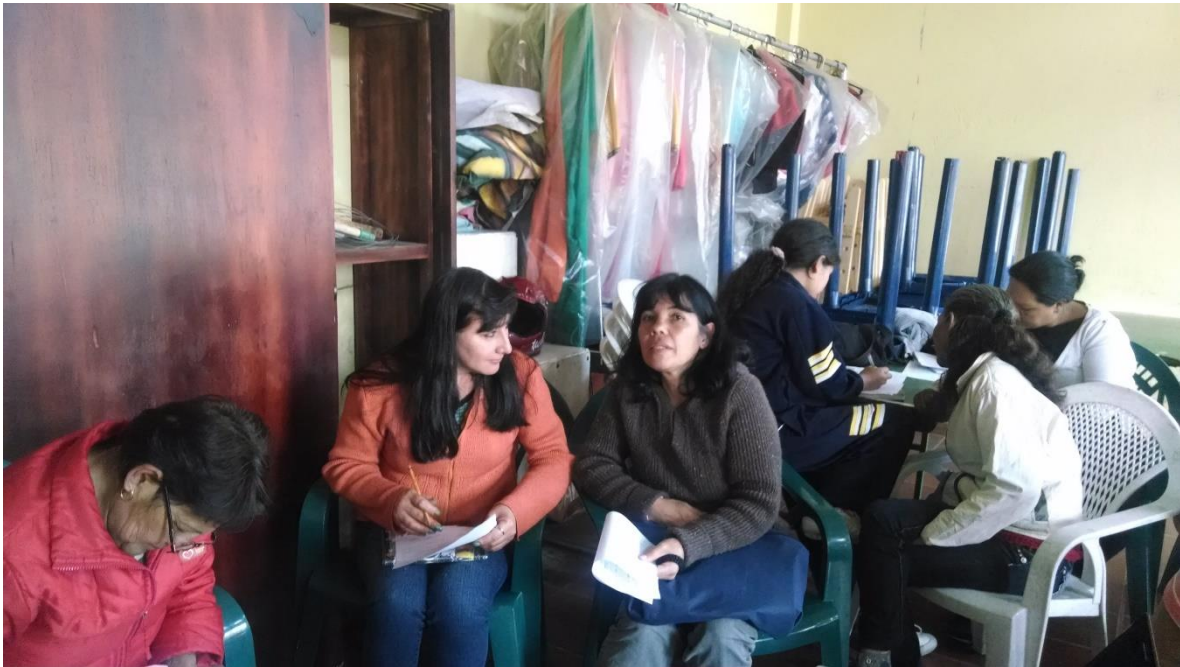
Charlas servicios bancarios, Sutatausa 20 de octubre 2014 por Angela Salcedo