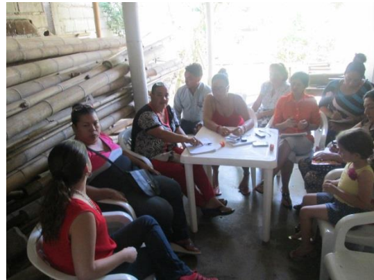
*Foto: Parque Principal local ArtePaz La Paz Guaduas. 2015