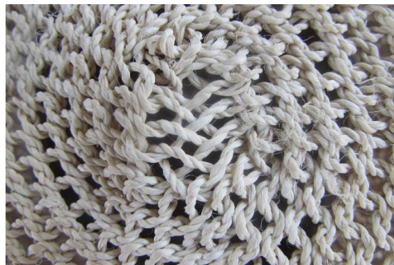
Foto 6 Base de la mochila tradicional tikuna Tomada por: DI. Adriana Sáenz F. Nazareth – Amazonas – 22/08/2014, Fundación Etnollano