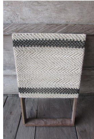
Foto 8 Marco de madera para tejer mochila Tomada por: DI. Adriana Sáenz F. Nazareth – Amazonas – 22/08/2014, Fundación Etnollano