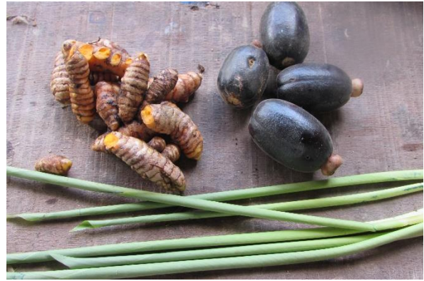
Foto 12 Azafrán, Huitillo, Buré (Bijao) Nazareth – Amazonas – 22/08/2014