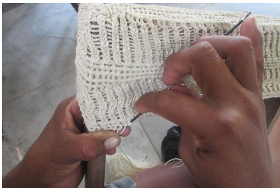
Foto 5 Tejido tradicional tikuna – Escama de Chirui abierto Nazareth – Amazonas – 22/08/2014, Fundación Etnollano