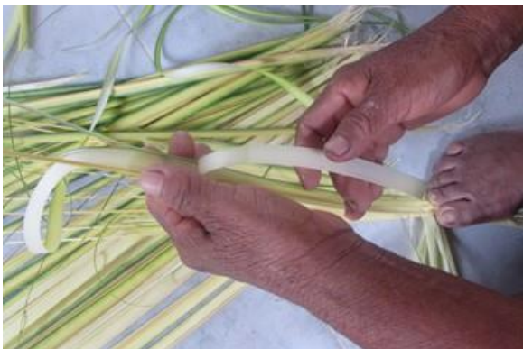
Foto 13 Proceso de extracción de la fibra de chambira Nazareth – Amazonas – 22/08/2014

La materia prima principal es el cogollo de la palma de Chambira, según las artesanas, el recurso se encuentra disponible en el rastrojo y en la chagra, cada familia tiene su sembrío, el borugo también ayuda en la siembra, se cosecha continuamente, “no tiene época”, se coge un cogollo por palma, se rota la cosecha a fin de proteger las palmas.