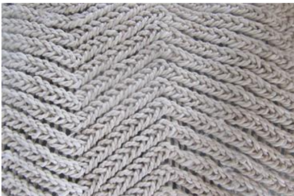
Foto 1 Tejido tradicional tikuna – Escama de Chirui diagonal Nazareth – Amazonas – 22/08/2014

La actividad artesanal principal es la tejeduría en chambira, el grupo se encuentra en un proceso de fortalecimiento de los tejidos tradicionales tikuna y estandarización de medidas, que es necesario acompañar en el mediano plazo.