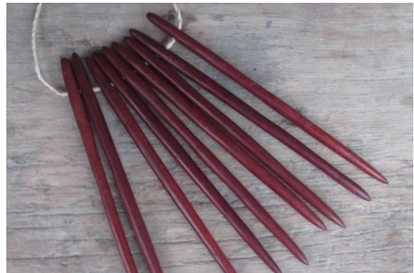
Foto 10 Aguja de palosangre utilizada por los ancestros para tejer mochila playera Nazareth – Amazonas – 10/10/2014, Fundación Etnollano

Es importante además, incentivar la siembra de las especies tintóreas y realizar talleres experimentales a fin de obtener nuevas opciones de color a partir de las especies disponibles (huito, huitillo, azafrán, achiotes, bijao).