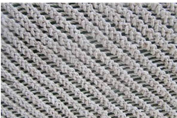
Foto 3 Tejido tradicional tikuna – Cola de Lagarto Tomada por: DI. Adriana Sáenz F. Nazareth – Amazonas – 22/08/2014, Fundación Etnollano