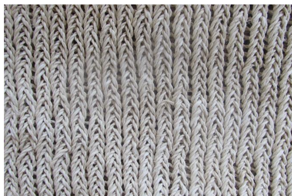
Foto 4 Tejido tradicional tikuna – Escama de Chirui vertical Nazareth – Amazonas – 22/08/2014