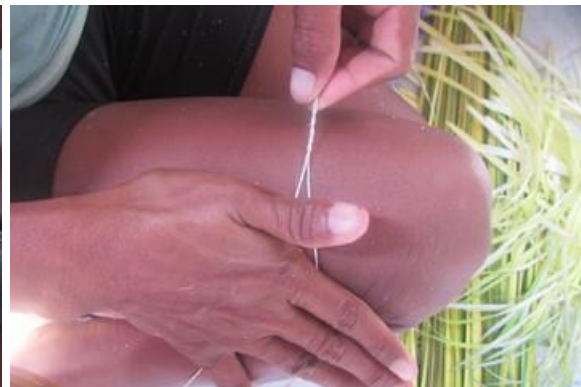
Foto 14 Proceso de hilado mediante torsión manual Nazareth – Amazonas – 21/10/2014