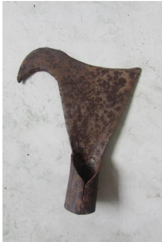
Foto 7 Garabato o medialuna, utilizada en la extracción del cogollo de chambira Nazareth – Amazonas – 09/10/2014