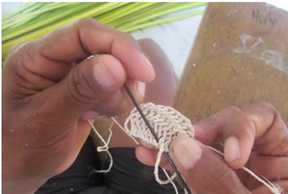
Foto 9 Aguja "de sombrilla", inicio de la mochila Nazareth – Amazonas – 22/08/2014