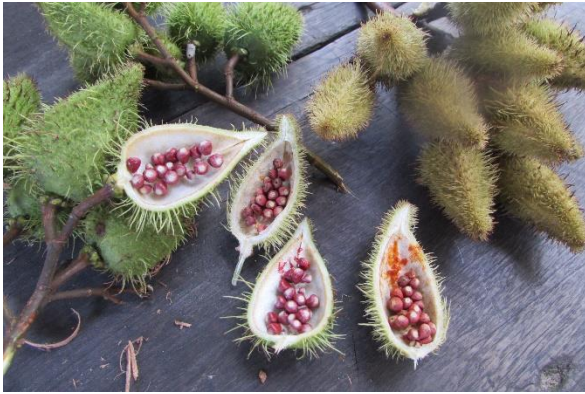
Foto 11 Achiotes rojo y naranja Tomada por: DI. Adriana Sáenz F. Nazareth – Amazonas – 22/08/2014, Fundación Etnollano