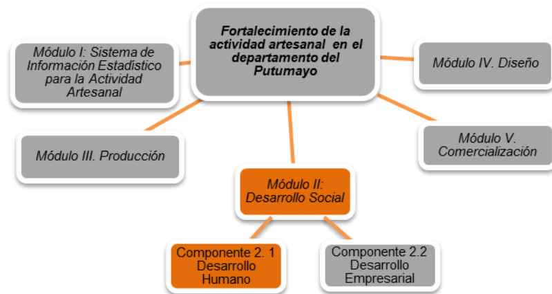
Ilustración 2. Esquema del proyecto