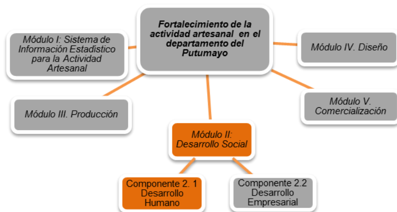
Ilustración 1. Esquema del proyecto