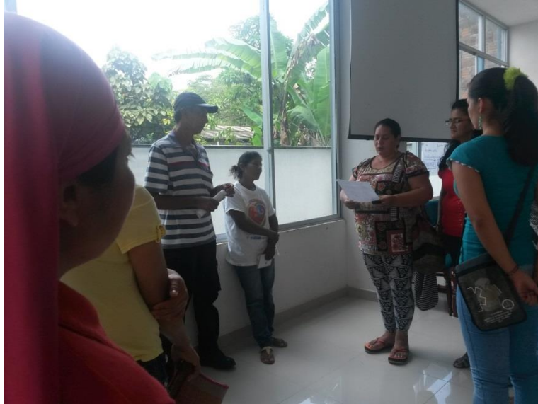
Fotografía 1. Dramatización de situación problema