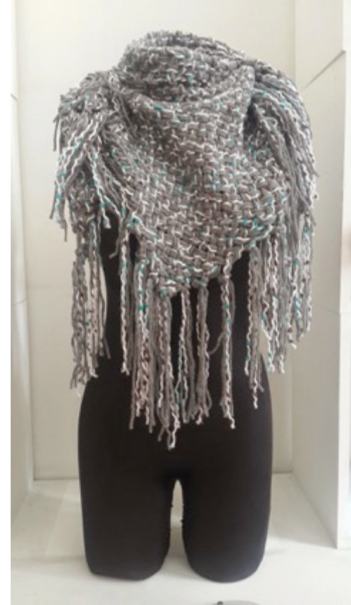
Manizales 20 de Octubre de 2014.