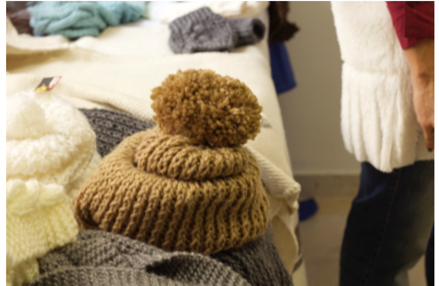
Manizales. 06 de Nov de 2014. Actuar microempresas