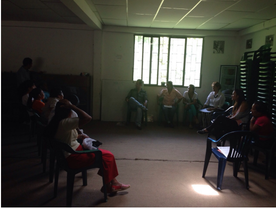
Riosucio 08 de sept de 2014.