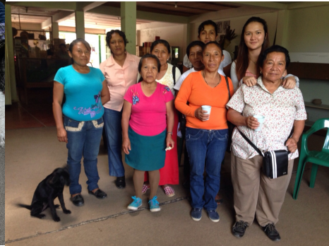
Riosucio 30de sept de 2014.