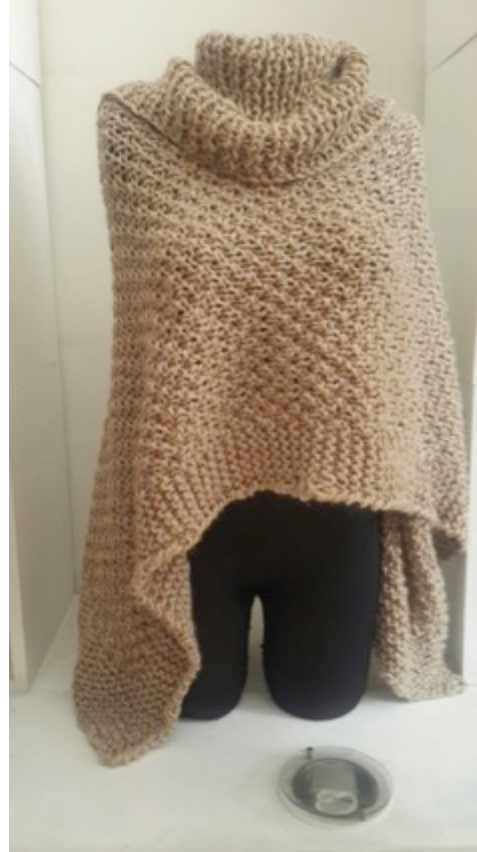
Manizales 20 de Octubre de 2014.