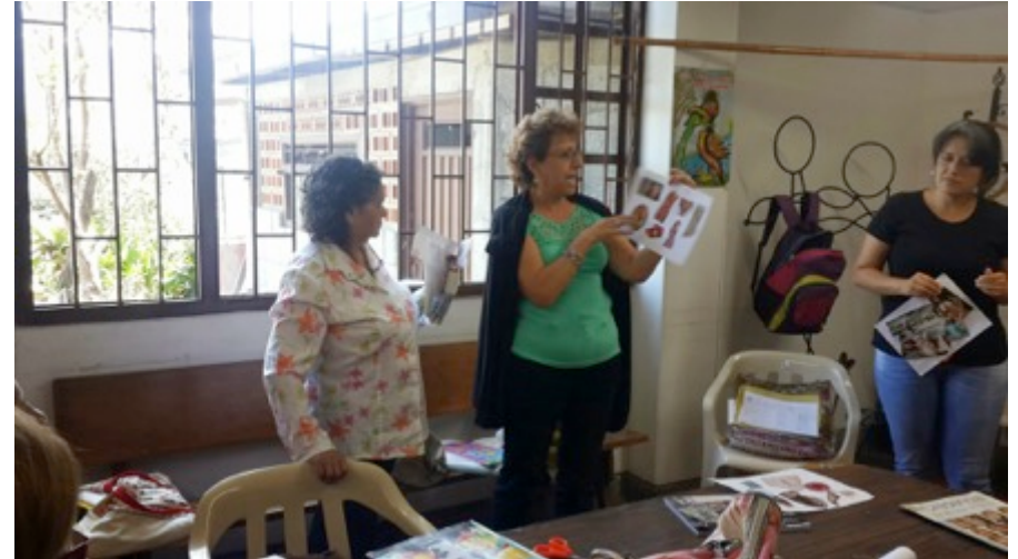
30 de Sept de 2014.