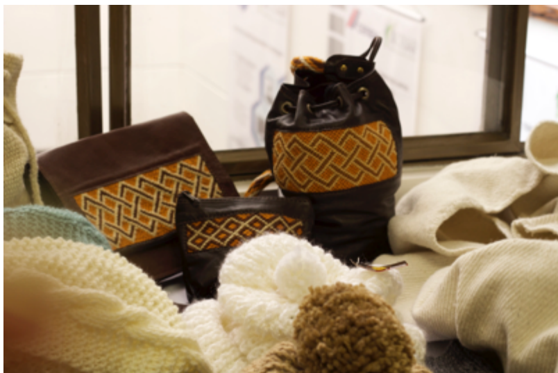
Manizales. 06 de Nov de 2014. Foto: Lily Cheung Actuar microempresas