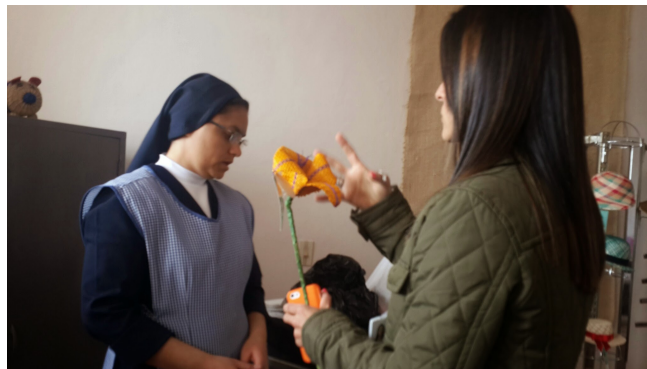
Aguadas 19 de sept de 2014.