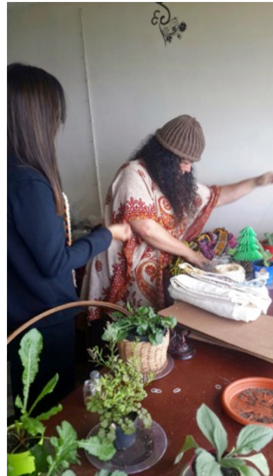
Manizales 07 de sept de 2014. Foto: Lily Cheung Clara Inés Orozco