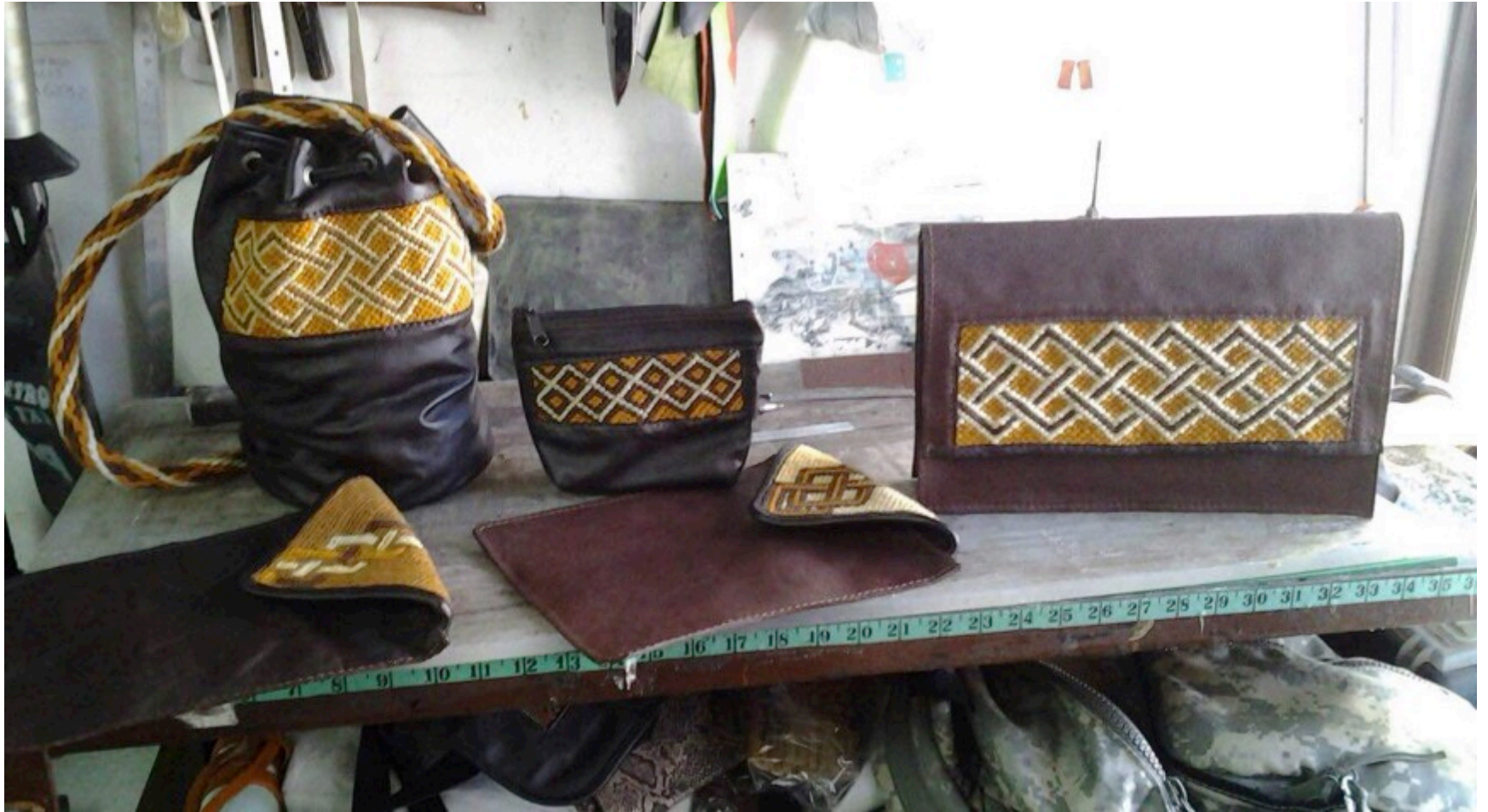
Manizales. 06 de Nov de 2014. Foto: Lily Cheung Actuar microempresas