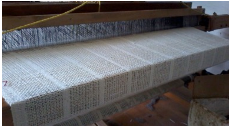
Manizales 05 de Nov de 2014.