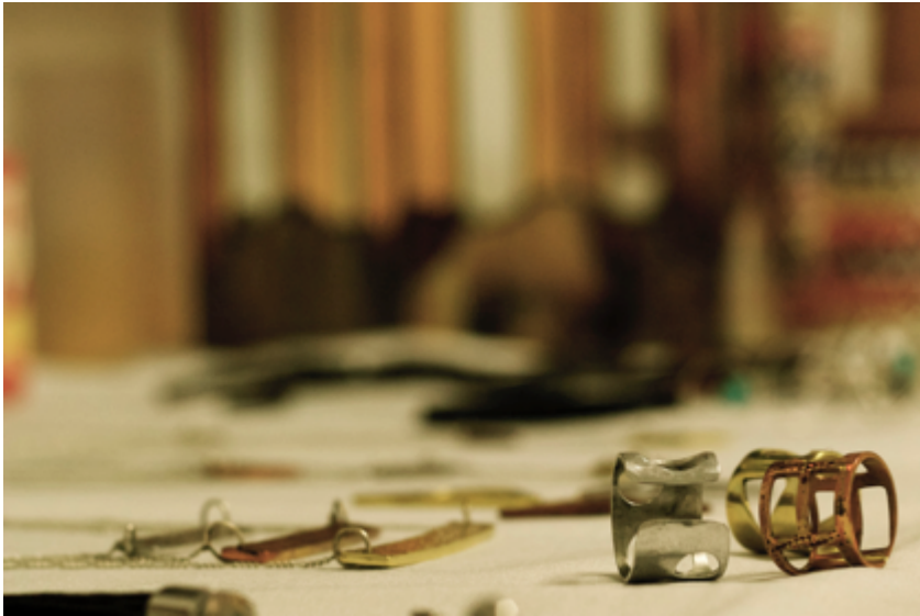
Manizales. 06 de Nov de 2014. Actuar microempresas