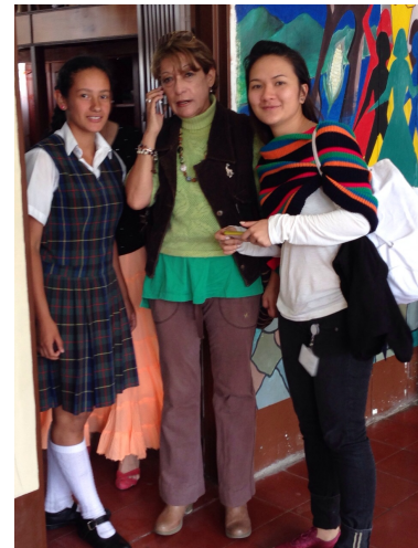
Aguadas 19 de sept de 2014.