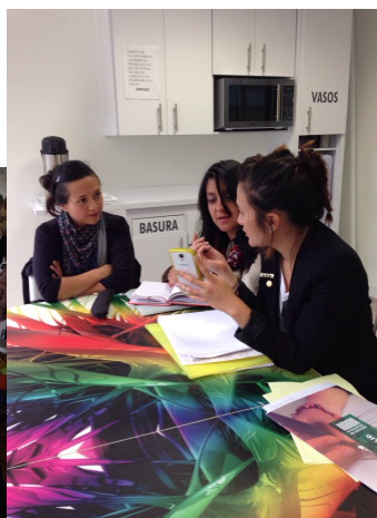
Manizales 18 Sept de 2014. Foto: Gloria Duque Cristina Pinta