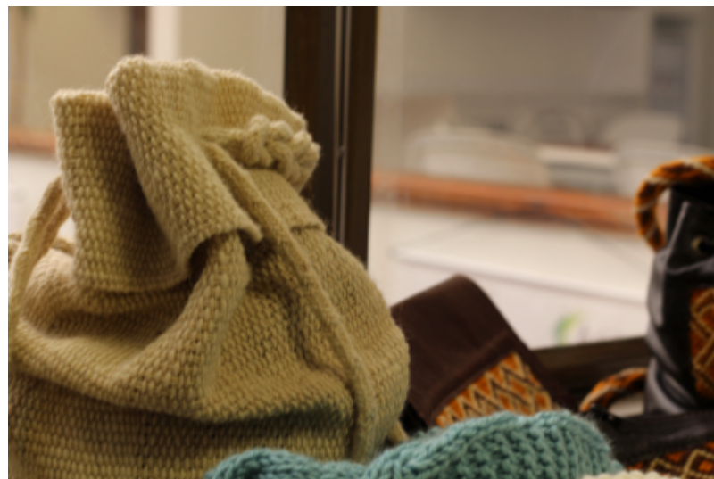
Manizales. 06 de Nov de 2014. Actuar microempresas