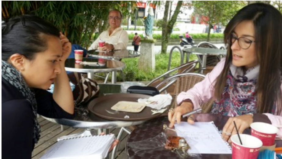
Manizales 11 de Octubre de 2014. Foto: Lily Cheung Cristina pinta.

Materialización de propuestas y revisión de otras en proceso, se realizan nuevos productos y diseños a partir de las sugerencias realizadas por los asesores de artesanías de Colombia – Bogotá