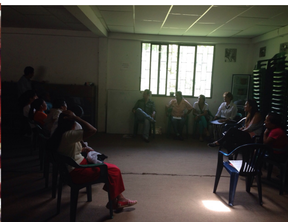
Riosucio 08de sept de 2014. Foto: Gloria Duque Com. San lorenzo