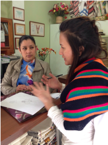
Aguadas 19 de sept de 2014.