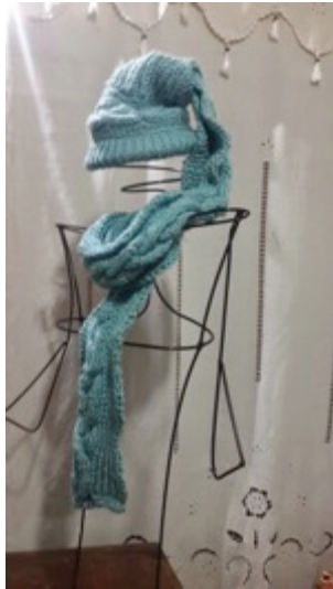
Manizales 25de Octubre de 2014. Foto: Lily Cheung Alicia Acosta.

Revisión de propuestas en proceso, se realizan nuevos productos y diseños a partir de las sugerencias realizadas por los asesores de artesanías de Colombia – Bogotá