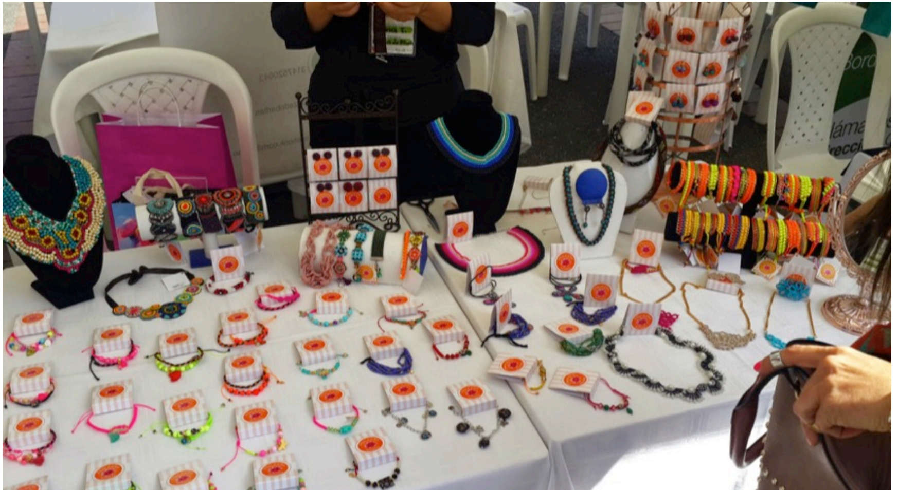
Manizales. 01 de Nov de 2014. Feria Actuar microempresas