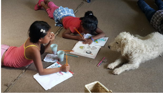
Riosucio 08de sept de 2014.