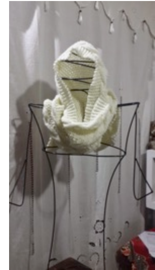
Manizales 25de Octubre de 2014.