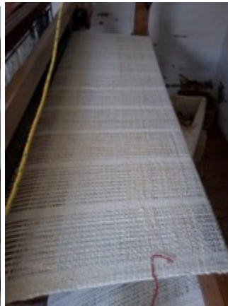
Manizales 05 de Nov de 2014.