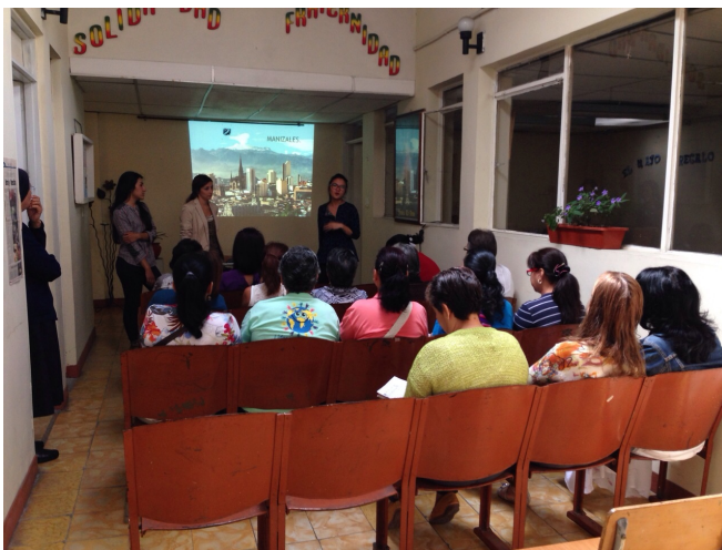
Manizales 16 Sept de 2014.