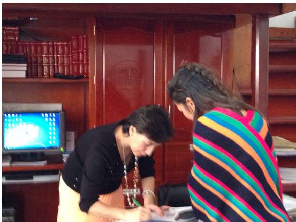
Aguadas 19 de sept de 2014. Foto: Gloria Duque Col. Claudina Múnera