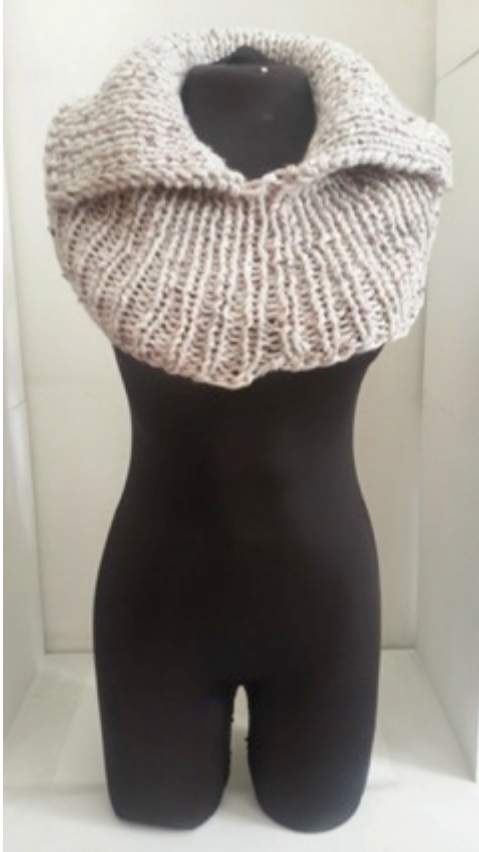
Manizales 20 de Octubre de 2014.

Revisión de producto para venta local y desarrollo de nuevas propuestas para expo artesanías.