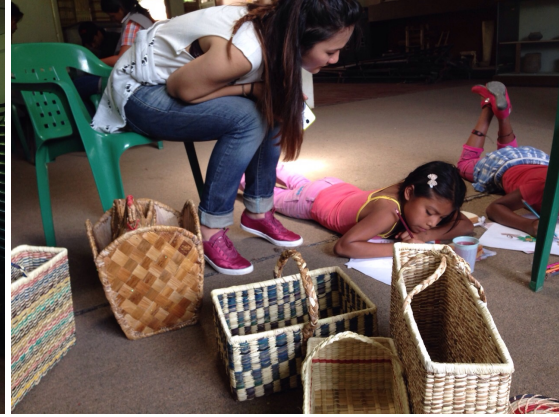
Riosucio 30 de sept de 2014. Foto: Gloria Duque Com. San lorenzo