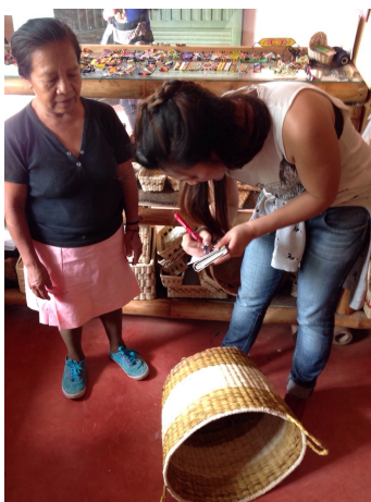
Riosucio 30de sept de 2014.