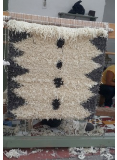
Salamina 05 de Nov de 2014. San Vicente de paul