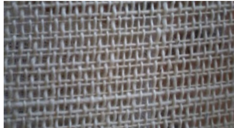
Manizales 05 de Nov de 2014.