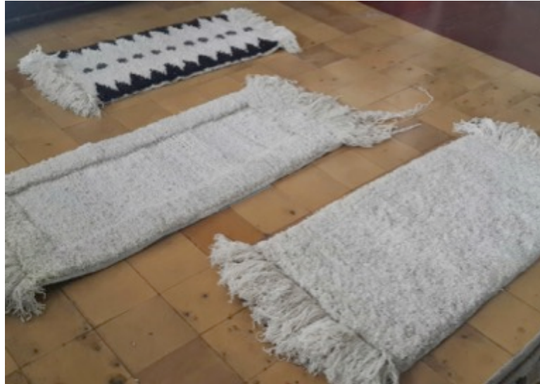
Salamina 05 de Nov de 2014. Foto: Lily Cheung San Vicente de Paul.