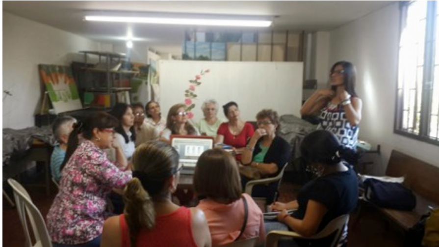
30 de Sept de 2014.