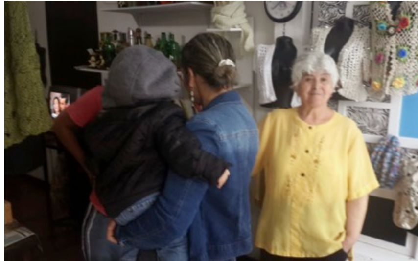
Manizales 25de Octubre de 2014.