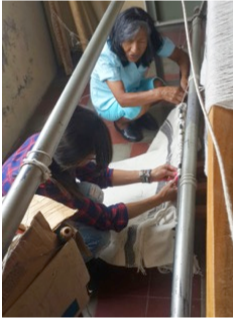
Salamina 05 de Nov de 2014. Foto: Lily Cheung San Vicente de Paul