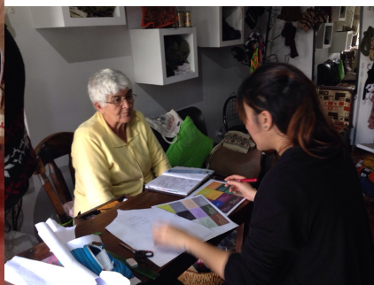
Manizales Sept de 2014.