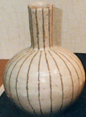
青島 磁器 大花瓶 1950年