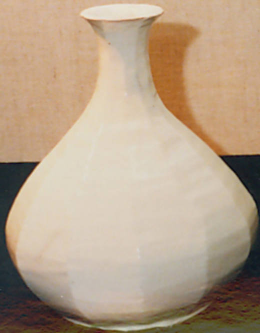
19. 白磁の花瓶 1900年 東京