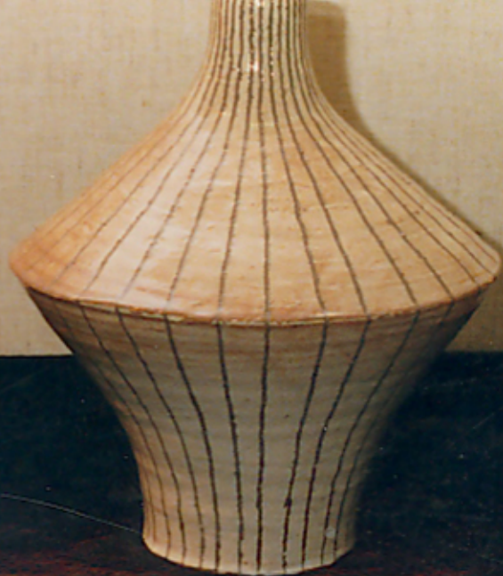
20. 白磁の花瓶 1900年 東京