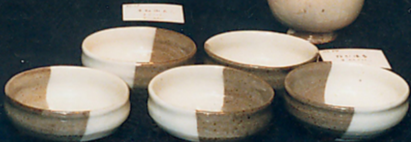
青島 磁器 大碗 1950年