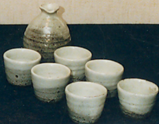
5. 小壺 6. 小壺 7. 小壺 8. 小壺 9. 小壺 10. 小壺