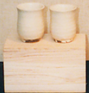
青島 磁器 小酒杯 1950年