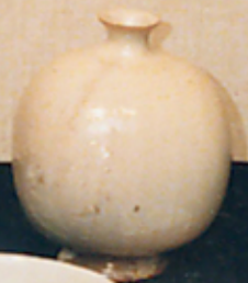
青島 磁器 小花瓶 1950年