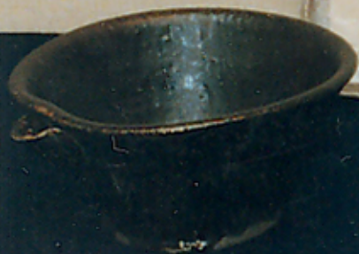
1. 深鉢 2. 深鉢 3. 深鉢