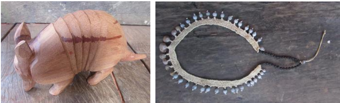
Identificación de productos actuales y desarrollo de nuevos productos, Puerto Nariño

Este viaje fue clave para promover el desarrollo de nuevos productos y direccionar cada producción, además de cimentar diagnósticos comunitarios.