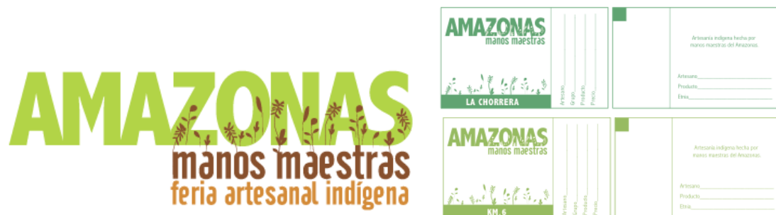
Materiales visuales, feria local

el espacio y los visitantes recibieron muy bien la muestra. La feria además de mostrar nuevos productos, contó con algunas exhibiciones de los grupos de baile y alimentos tradicionales, lo cual atrajo también al público (para mayores detalles ver Informe de Feria local, realizado por Emilia Atiesta).