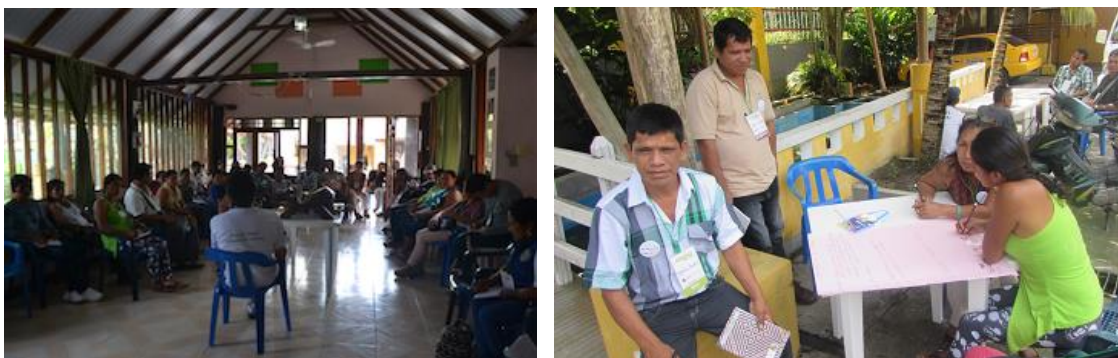
Taller comercial en Leticia, 27 de noviembre

El taller consistió en un intercambio entre los 8 grupos participantes del proyecto, bajo el tema cultural y con énfasis principal en el tema comercial. Se llevaron a cabo actividades de dibujo de referentes, juego de clínica de ventas y lluvia de ideas de proyección artesanal (para mayores detalles ver Informe de Feria local y Taller comercial).