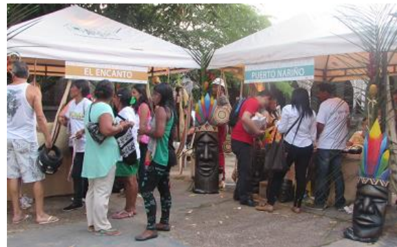
Feria local en Leticia: "Amazonas, manos maestras"

Se realizó durante los días 28 y 29 de noviembre la feria artesanal "Amazonas, manos maestras". La feria fue llevada a cabo frente al Hotel Victoria Regia y contó con la participación de las 8 comunidades del proyecto, además de un grupo del departamento del Putumayo (Comunidad Lagarto Cocha), invitado por Fupad al evento.