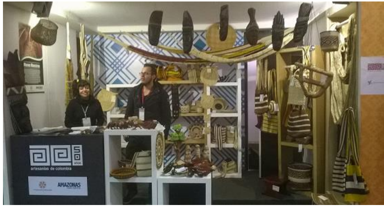
Stand Amazonas, Expoartesania 2014

Algunos de los nuevos productos conseguidos: