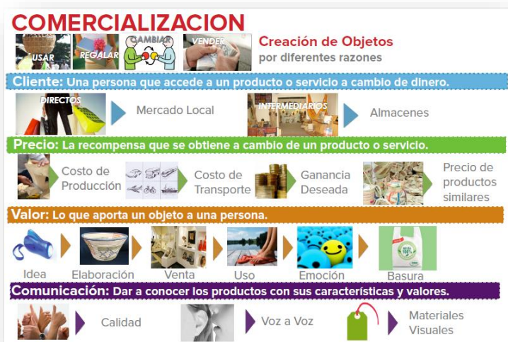
Cartelera, Taller comercial 1

*Al cierre de este informe aún se está en proceso de sistematización de los resultados de este viaje.