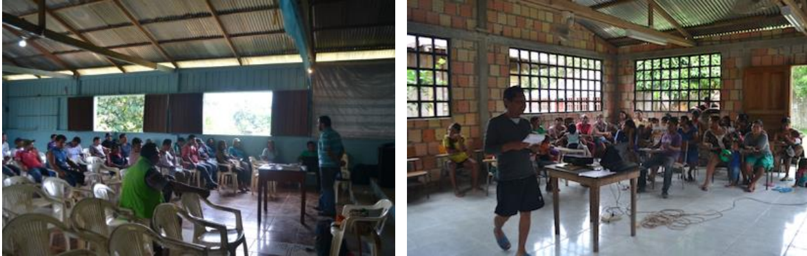
Reuniones de socialización del proyecto (Macedonia y Nazareth)