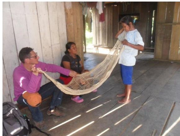
Viaje de diagnóstico, El Encanto