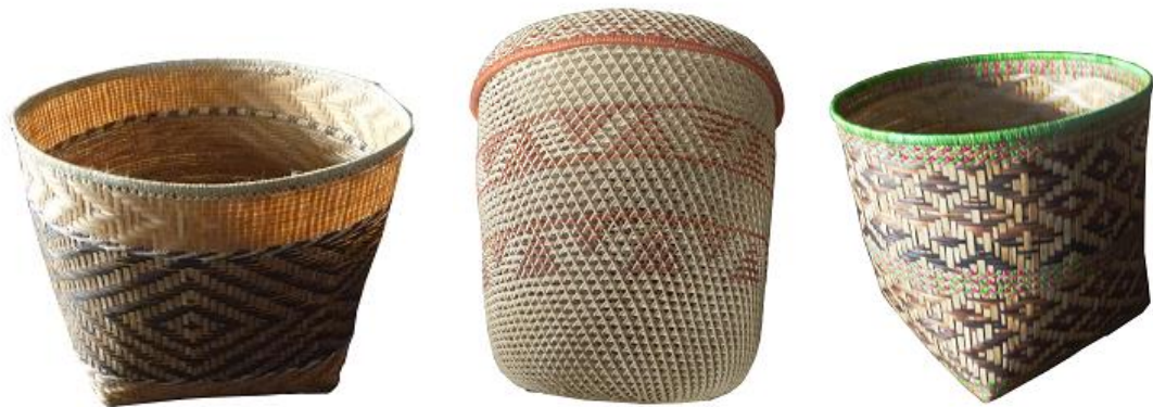
Inspiración para nuevos productos, La Chorrera