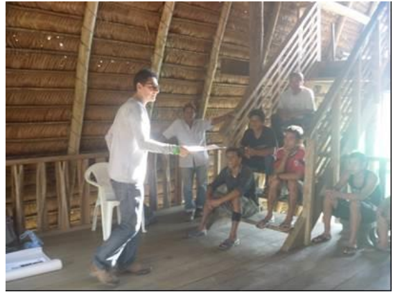
Talleres de diagnóstico, Kilómetro 6

Los objetivos principales a abarcar desde el trabajo del diseñador fueron: