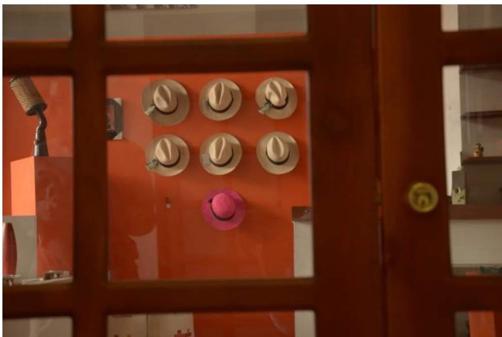
La tienda Artesanías de Caldas está cerrada desde hace unos cinco meses.