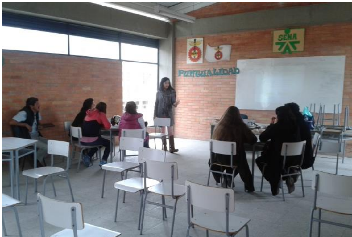
TALLER CONTABILIDAD - PAIPA – INSTALACIONES SENA – 11 DE JUNIO DE 2014 – DIANA MONTAÑEZ R. – ARTESANÍAS DE COLOMBIA

artesanías de colombia LABORATORIO BOYACÁ