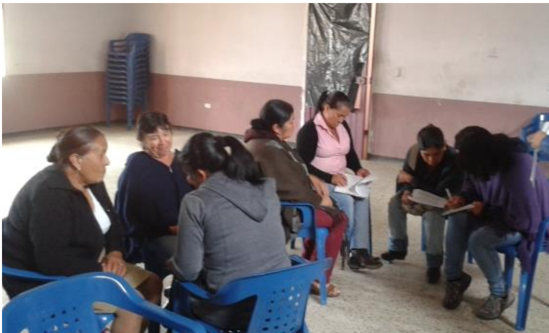
TALLER CONTABILIDAD/LLB - CERINZA – BIBLIOTECA MUNICIPAL – 29 DE MAYO DE 2014 – DIANA MONTAÑEZ R. – ARTESANÍAS DE COLOMBIA