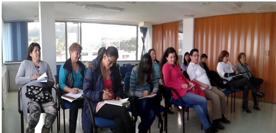
TALLER CONTABILIDAD - DUITAMA – AUDITORÍO ALCALDIA – 04 DE JUNIO DE 2014 – DIANA MONTAÑEZ R. – ARTESANÍAS DE COLOMBIA