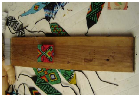
Instrumentos musicales - Manuales