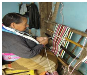
Tallado en madera –Manuales