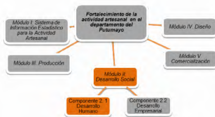
Ilustración 1. Esquema del proyecto