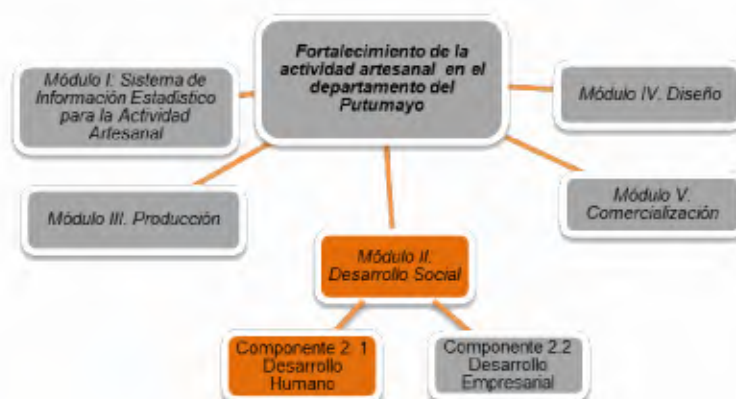
Ilustración 1. Esquema del proyecto

Estas acciones al igual que el análisis del plan de vida y el proyecto de vida hacen parte del módulo de desarrollo social en el componente de desarrollo humano que pretende fortalecer el crecimiento personal y comunitario, logrando el desarrollo que propenda por un mejor bienestar equitativo para toda la población, a través de un enfoque desde lo particular de los pueblos indígenas y la riqueza de todo el contexto del Departamento del Putumayo.