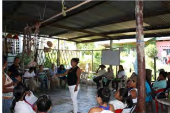
Ilustración 1. Ejecución del taller Análisis Plan de Vida

Fuente: artesano Indígena. Puerto Leguizamo Taller de proyecto de vida, noviembre de 2014