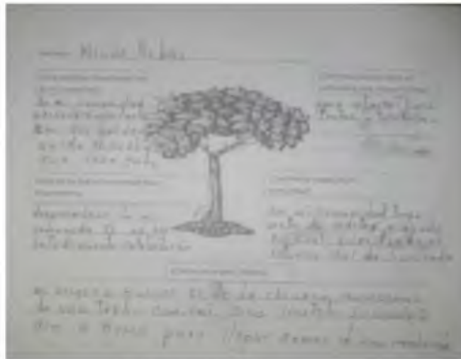
Ilustración 2. Árbol de la vida

Fuente: artesano Indígena. Puerto leguizamo Taller de proyecto de vida, noviembre de 2014