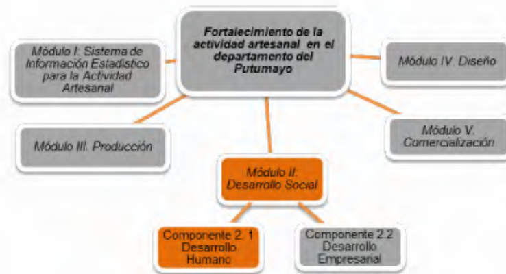
Ilustración 1. Esquema del proyecto