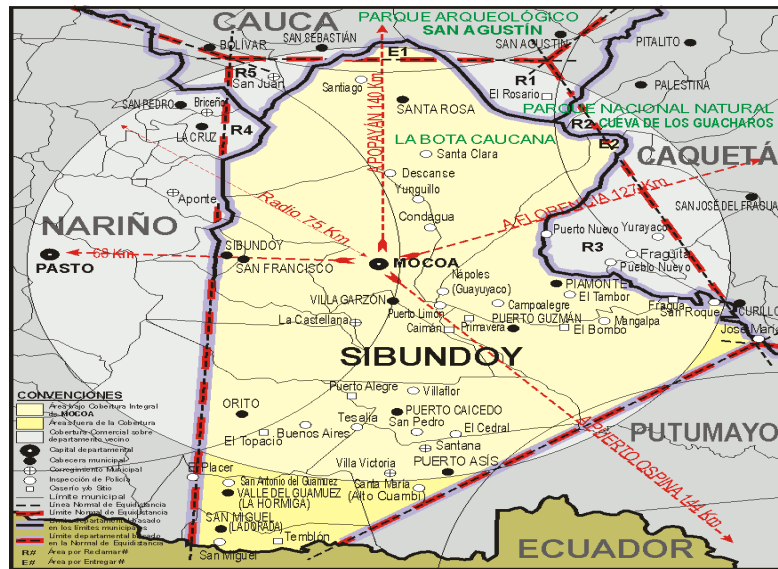
Ilustración 1. Mapa geográfico