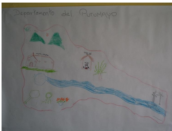
Foto 2. Cartografía social

Fuente: artesanos (Municipio de Sibundoy). Taller de cartografía social, Octubre de 2014.