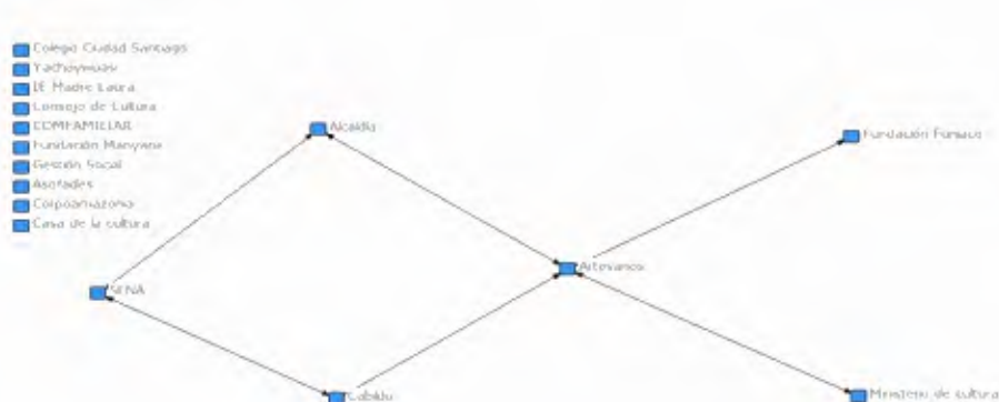
Ilustración 2. Mapa de relaciones