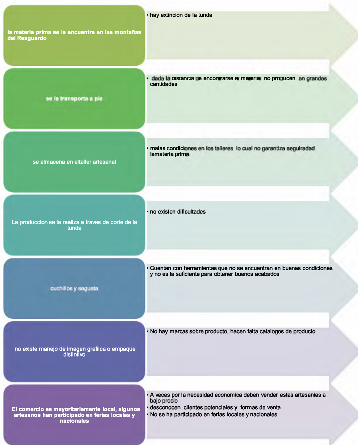
Tabla 1. Mapa artesanal de instrumentos musicales