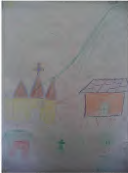
Foto 2. Cartografía social

Fuente: artesanos (Inspección de San Andrés municipio de Santiago). Taller de cartografía social, Octubre de 2014.