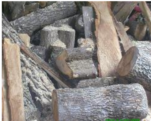
Ilustración 2 Foto Materia Prima