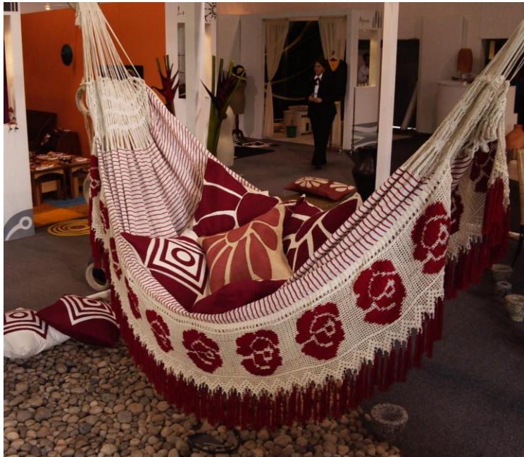
Casa Colombiana 2007