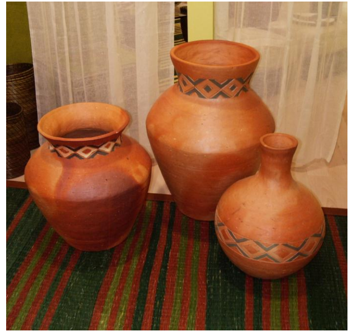
Casa Colombiana 2007