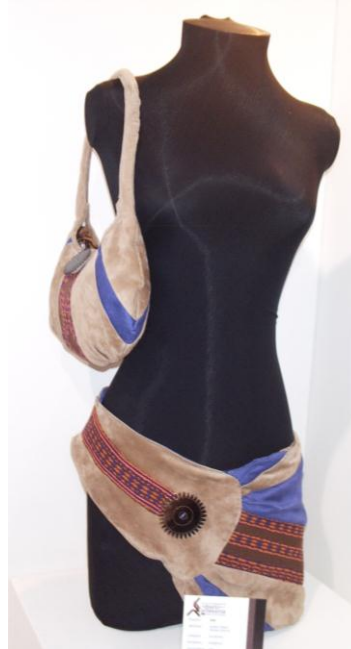
Casa Colombiana 2007