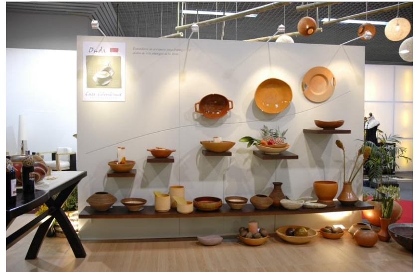
Casa Colombiana 2006