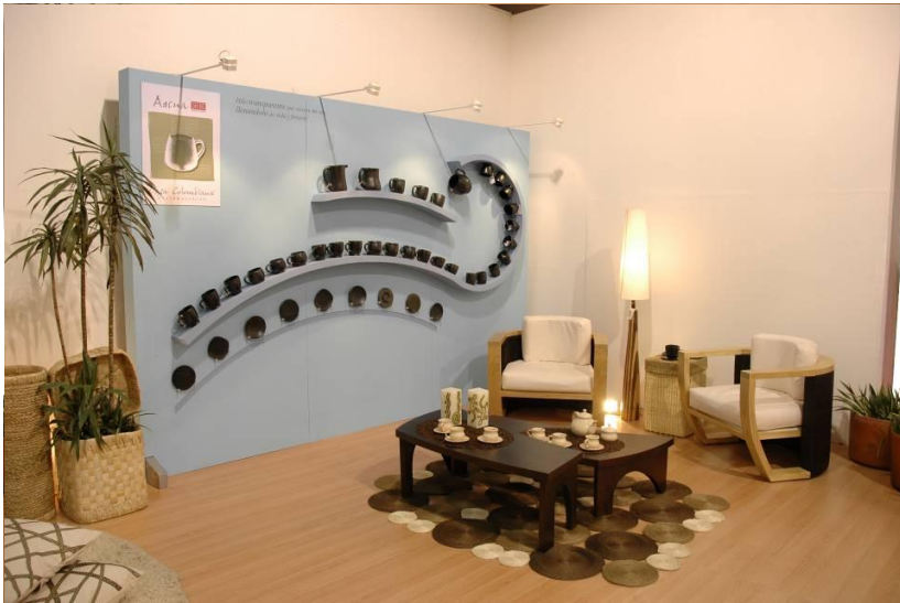
Casa Colombiana 2006