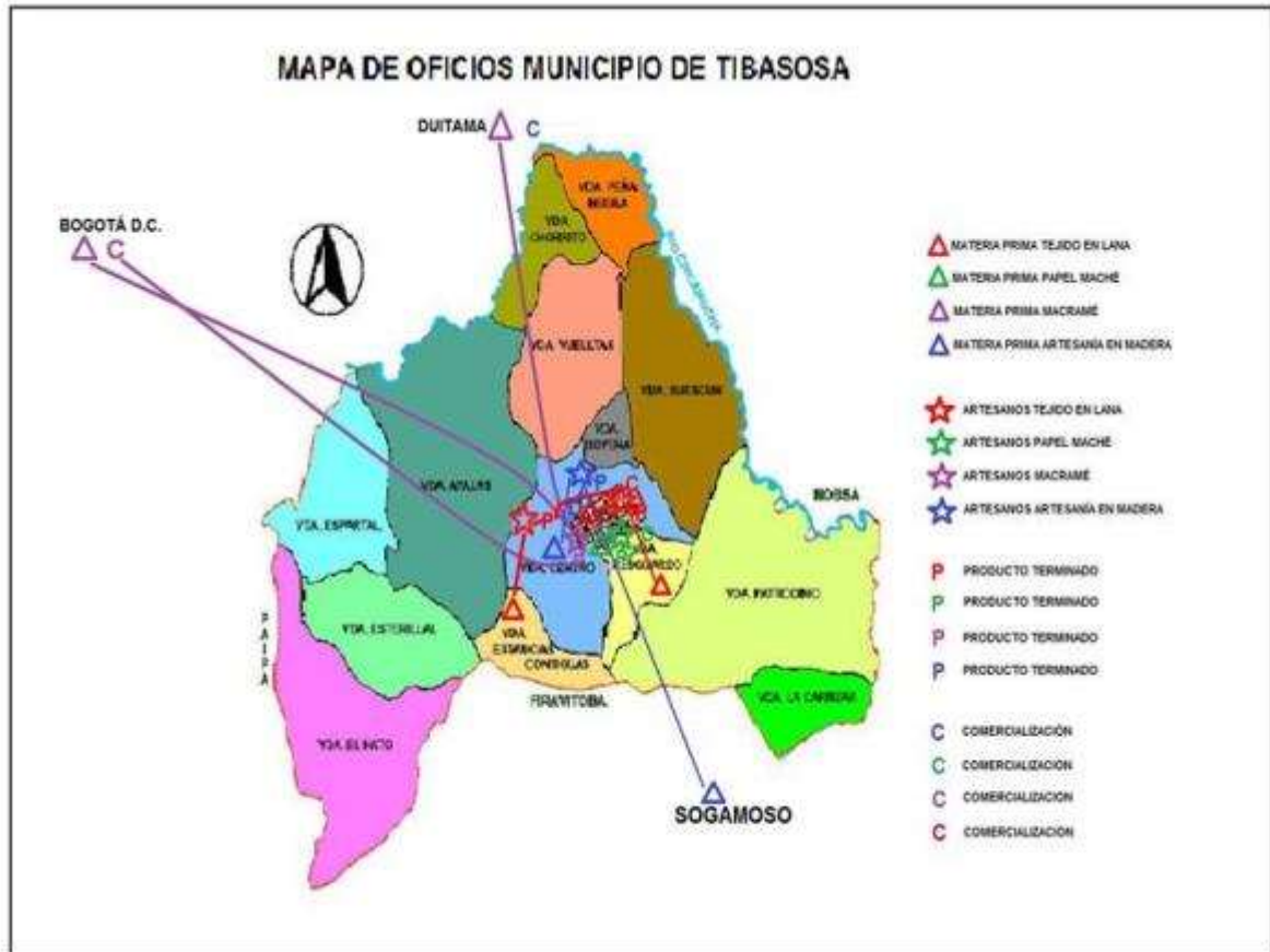
Gráfico N° 1. Mapa de Oficios del municipio de Tibasosa.