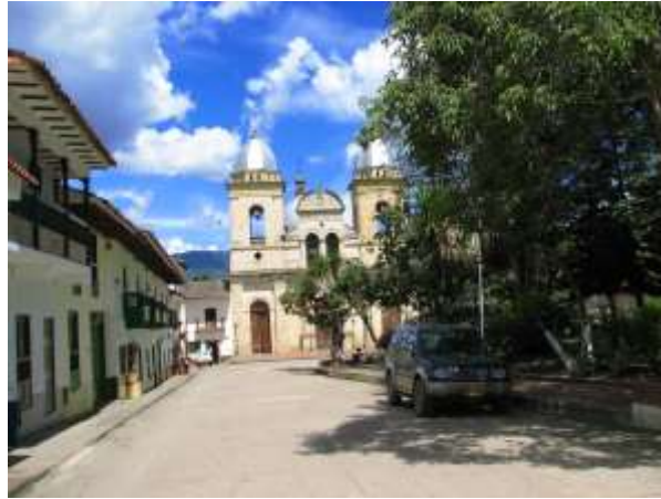
Figura 2. Iglesia de Tenza. Foto tomada por Angélica Suaza, 23 de septiembre de 2014. Cedavida-Artesanías de Colombia

Las actividades económicas de mayor importancia son la agricultura, la ganadería y el comercio. Los principales cultivos son el frijol, el maíz, la caña de azúcar y la yuca. La producción artesanal ubica al municipio en un lugar importante dentro de la economía regional. Su principal producto artesanal es la cestería. Las actividades más destacadas en el municipio guardan relación con los productos de origen agropecuario y artesanal.