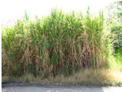
Figura 4. Plantas de chin en la carretera de Tenza. Foto tomada por Angélica Suaza, 25 de septiembre de 2014. Cedavida-Artesanías de Colombia.

La materia prima de los artesanos de Tenza es el chin que es obtenido de las propias fincas y de las fincas de los vecinos, quienes lo venden. Elaboran sus artesanías en sus casas. La trenza de junco la compran a vendedores especialistas en este ramo.