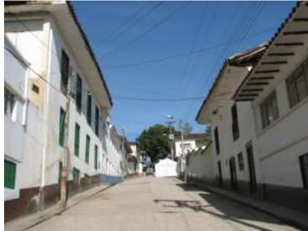
Figura 1. Calle de Tenza. Foto tomada por Angélica Suaza, 23 de septiembre de 2014- Cedavida-Artesanías de Colombia