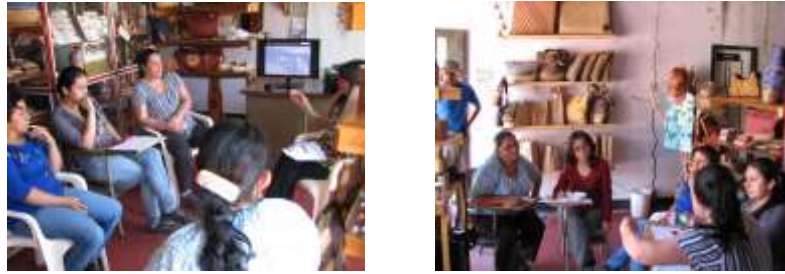
Figura 3. Socias de la EAT La Esperanza en el taller-local, elaborando el diagnóstico. Foto tomada por Claudia Helena González, 26 de septiembre de 2014. Cedavida-Artesanías de Colombia.

La gobernación y ellas mismas han financiado la capacitación por parte de una diseñadora, igualmente con un crédito ante el Banco Agrario compraron su primer máquina. La Alcaldía les dio un local y cada familia aportaba algo y vendía. Ahora trabajan como socias para ello recurrieron a especializarse y a trabajar en cadena productiva. Al principio no les rendía, por ejemplo sólo hacían un individual diario ahora hacen 10 a 12 al día.