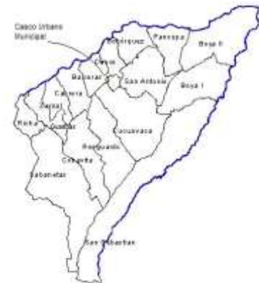
Figura 2: Municipio de Somondoco.

Límites del municipio: Oriente: Almeida Occidente: Guayatá Norte: Guateque y Sutatenza