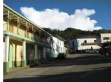
Figura 1. Calles de Somondoco. Foto tomada por Angélica Suaza, 27 de septiembre de 2014. Cedavida-Artesanías de Colombia.

Bajo estas circunstancias Somondoco fue fundado en 1537 y elevado a municipio en 1656. La palabra Somondoco en lengua chibcha tiene el siguiente significado: