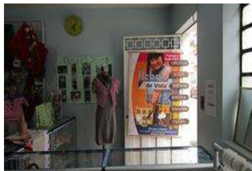
Imagen del punto de venta y sede de la Asociación Hebras de Vida en el centro de Sogamoso. En este espacio se reúnen las artesanas para desarrollar procesos formativos, para generar nuevos diseños y para realizar sus productos.

Artesanas de diferentes generaciones hacen parte de Hebras de Vida. En la imagen pueden verse algunos de los trabajos realizados por estas artesanas, en diferentes técnicas, enfocados tanto hacia la temporada decembrina como a públicos diversos como mujeres, niños y hombres.