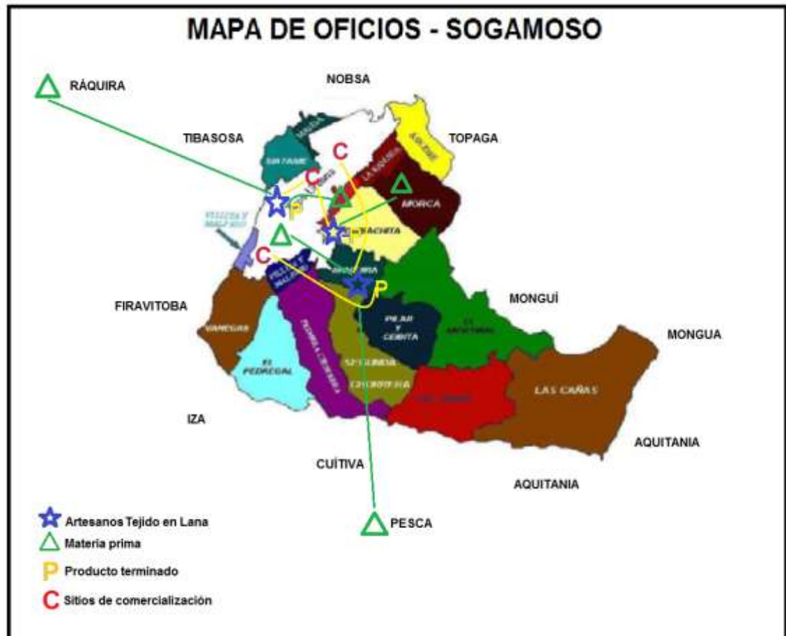
Grafico N° 1. Mapa de Oficio del municipio de Sogamoso.