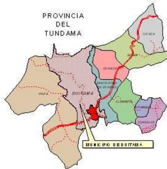
Figura 2. Ubicación de Duitama en la Provincia de Tundama.

La ciudad está rodeada y atravesada de sur a norte por los cerros de la Milagrosa o el Calvario, San José Alto, Alacranera o Tavor, la Tolosa, el Cargua, Tocogua, Pan de Azúcar, el Cerro del Nevado, el Alto del tigre y el Monte Rusio (más conocido como el páramo de la Rusia). En el área urbana se identifican los cerros tutelares de la Milagrosa, La Tolosa y San José (La Alacranera), cerro las lajas y cerros perimetrales como el cerro Las Cruces y el cerro Cargua.