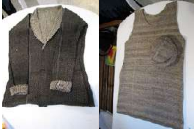
Figura 6. Productos elaborados por las artesanas de Copramads. Fotos tomadas por Angélica Suaza, 5 de noviembre de 2014. Cedavida-Artesanías de Colombia

Esta asociación ha recibido apoyos, como el del proyecto Dinosaurios, Fundación Semillas para la compra de materia prima. Por otra parte, a través de la Gobernación y la Alcaldía recibieron dos telares y de nuevo materia prima.