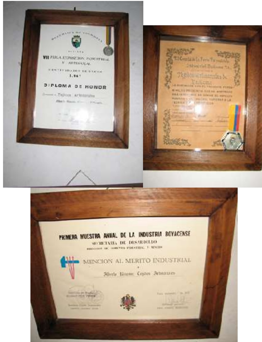
Figura 3. Certificaciones familiares de la tradición de la familia de la artesana Elva Rincón. Fotos tomadas por Angélica Suaza, 5 de noviembre de 2014. Cedavida-Artesanías de Colombia

Para ella hacer “productos con historia y tradición, y debe hacerse con amor” 1 . En su trayectoria considera que las instituciones que atienden el sector artesanal deberían concertar proyectos y actividades para que sea un solo proyecto y no haya tantas visitas y se puedan realizar procesos serios y de larga duración. De