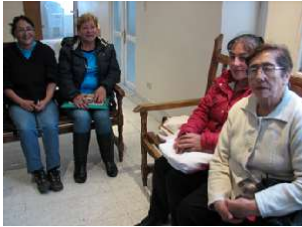
Figura 5. Socias de Saraswati

Misión: Promover el empoderamiento económico, político, social, cultural y ambiental de las mujeres mediante la consolidación de la empresa de producción, transformación y comercialización de artesanías y manualidades liderado por la “asociación de mujeres Saraswati” en base al crecimiento de la conciencia colectiva y cooperación con otras organizaciones, articulando la dinámica económica y social con valores y principios propios de la organización; aplicando, mejorando e innovando las técnicas en producción, transformación, comercialización, servicios de información y comunicación, mejorando las relaciones de poder equitativo para desarrollar las capacidades técnicas, gerenciales y comerciales de cada una de las asociadas mediante formación y capacitación. Además de contribuir al desarrollo de políticas públicas canalizando todos los esfuerzos con el fin de mejorar las condiciones de vida de todos.