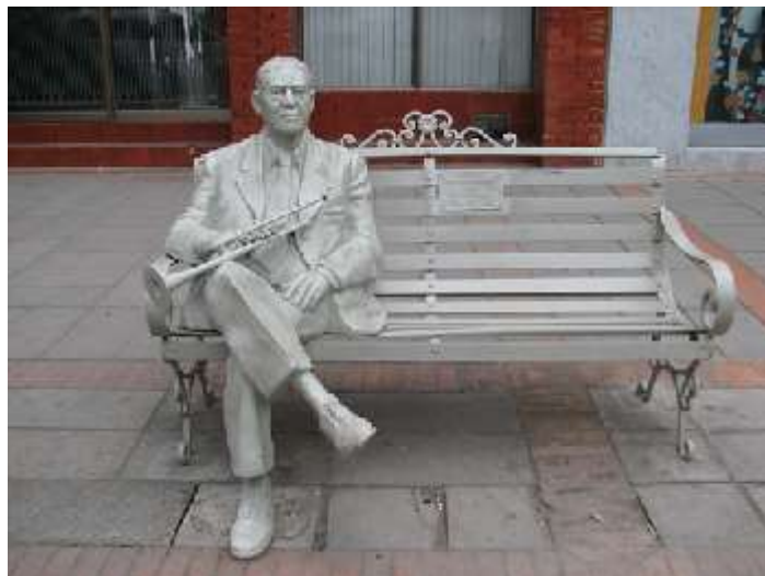
Figura 1. Escultura en Duitama. Foto tomada por Angélica Suaza, 4 de noviembre de 2014. Cedavida-Artesanías de Colombia

El nombre de Duitama es de origen Chibcha, corresponde a un caserío de indios habitado por pobladores de origen Muisca gobernado por el Cacique Tundama, vocablo que cambio por Duitama, señor absoluto y poderoso que tenía por jefes tributarios a los Caciques Onzaga, Soatá, Chitagoto, Susacón o Cabita, Icabuco, Lupachoque, Sátiva, Tutazá y Cerinza.