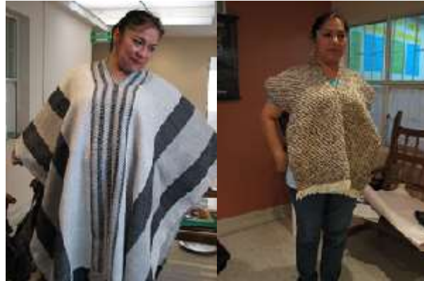
Figura 5. Ruanas elaboradas por las artesanas de Saraswati. Foto tomada por Angélica Suaza, 4 de noviembre de 2014. Cedavida-Artesanías de Colombia

Esta asociación conformada por 10 mujeres fue creada hace 10 años, como resultado de una invitación de la Casa de la Mujer, en un diagnóstico que se estaba realizando sobre la situación de las mujeres en Colombia. De este encuentro surgieron varias organizaciones, una de ellas “Saraswati”, mujeres que tejen tanto en telar como en aguja. Su principal materia prima es la lana de oveja, aunque a veces utilizan lana sintética.