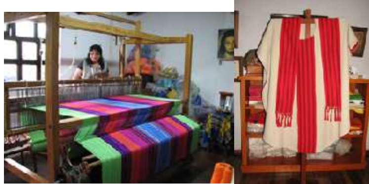
Figura 4. Taller y productos artesanales

hecho considera, que el principal problema del sector artesanal es la comercialización, “y este lo debería liderar Artesanías de Colombia” 2