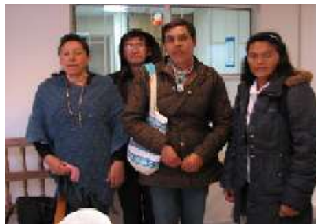
Figura 6. Artesanos de Copramads. Fotos tomadas por Angélica Suaza, 5 y 6 de noviembre de 2014. Cedavida-Artesanías de Colombia

Esta asociación surgió a raíz de un curso dictado por el Sena enfocado en el oficio artesanal. En el curso “salieron a la feria de la Cámara de Comercio y desde ahí