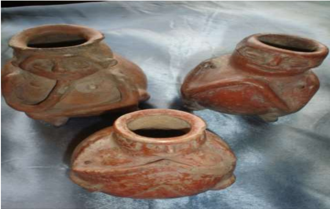
23. Tunjos o vasijas antropomorfas modeladas de la fase capulí; presentan perforaciones en la parte superior de la cabeza conocidas como gazofilacios, servían posiblemente como recipientes para depositar hojas de coca machacada o para preservar cenizas de restos humanos con jerarquía cacical. Fueron utilizadas durante los actos ceremoniales.