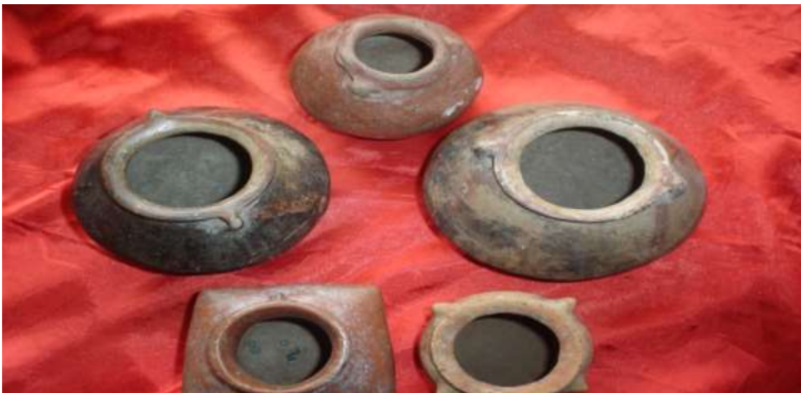
24. ollas lenticulares de forma redondeada corresponden a la fase capulí, cuya característica principal es la representación zoomorfa de ciertos animales totémicos (serpientes, sapos, monos, etc.) de la religión. Artefactos de uso doméstico y pintura monocroma.