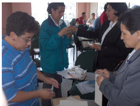
Actividad Grupal teórica de conocimiento. Localidad de Kenedy