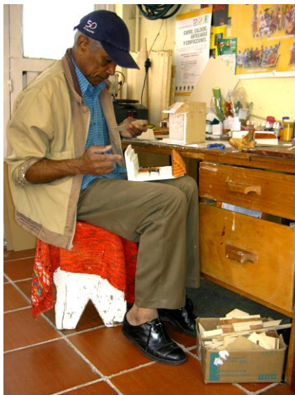
Puesto de trabajo, localidad de Fontibón