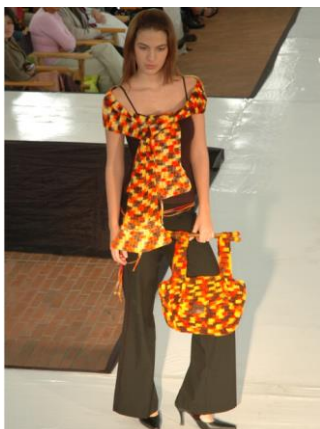
Productos exhibidos en la clausura