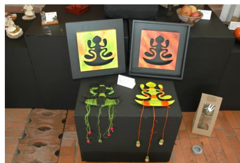
Laboratorio Colombiano de Diseño para la Artesanía y la Pequeña Empresa, Unidad Nacional de Bogotá - Subgerencia de Desarrollo