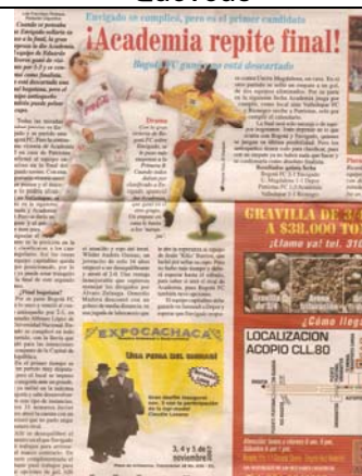
Publicación aviso de prensa – Periódico El Espacio

6. Constancias de participación El día 8 de noviembre en el Auditorio "Gustavo Caamaño" de la sede la Universidad Distrital Francisco José de Caldas, se entregaron las