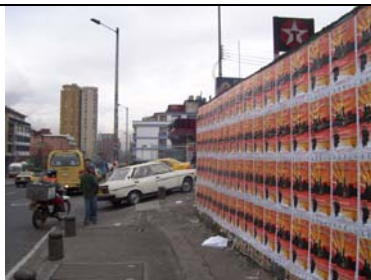
Afiches Expocachaca – Calle 53 con Carrera 7