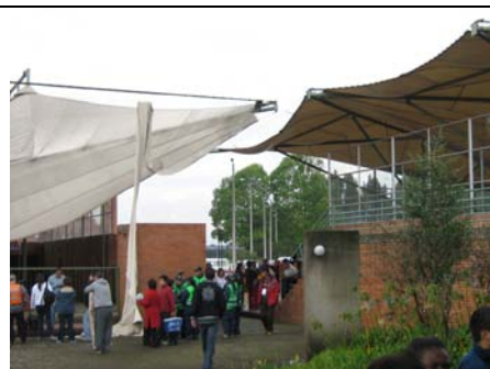
Estado Plaza No. 3 y 4 después de la tormenta

Claudia Lozano. A los beneficiarios se les dotó con una escarapela distintiva, 100 tarjetas de presentación por persona; además de la decoración interior y exterior de cada stand, que se componía de: Banderines, exhibidor de mercancías, telas (roja y amarilla). La muestra artesanal y gastronómica fue pospuesta.