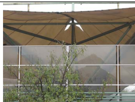
Daños Plaza No. 3