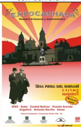
Afiche de Expocachaca