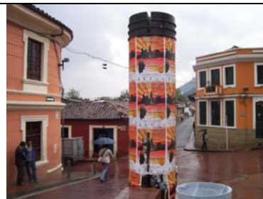
Afiches Expocachaca – Chorro de Quevedo