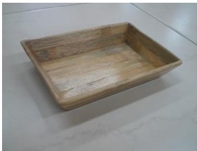
Artesana: Gladys Bueno Producto: Frutero

Productos para caballeros tradicionales, siendo éste su mercado objetivo. Se planteó la posibilidad de buscar mercados juveniles, a través de diseños más acorde con las tendencias de la moda y con apariencia más comercial. Se planteó el uso del color, se enfatizó mucho sobre la manera y la importancia de la confección como componente de diseño y, a su vez, sobre la necesidad de buscar nuevos mercados con aplicación de las técnicas, bordados y calados, en productos diferentes al de moda.