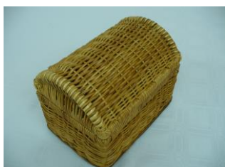
Artesano: Omar Ortíz Producto: Baúl - organizador

Éste, como todos los producto de forma simple, puede hacerse más estético por medio del color, para lo cual no es necesario saturar de esta característica el objeto, sino convertirlo en un acento dentro del mismo, a su vez, es conveniente dejar a la vista el tono natural del material. La función de contenedor puede orientarse hacia un uso más específico, y de esta forma, concebir un producto para un mercado más definido.