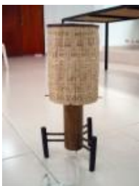
Artesana: Dora Sánchez Producto: Lámpara

Guadua y Guasca. Se encontró ausencia de armonía en el producto. Formalmente hay que buscar integrar mejor cada una de las piezas. El punto de partida es conservar el manejo de ambos materiales, no necesariamente de la técnica. En el caso puntual de la guadua, se puede involucrar el calado y ensamble de piezas. La línea del producto se puede conservar en el tema de iluminación de mesa y se debe entrar a dimensionar mejor el producto.