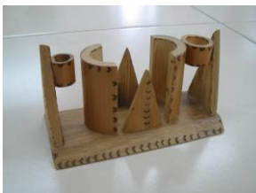
Artesana: Gladys Bueno Producto: Servilletero

Para la elaboración de este producto se utilizó material aglomerado en forma de tablero, para prestar una función de soporte. Sin embargo, no se encontró una buena definición del producto, en su forma, ni espacios para el agarre o sujeción de la pieza. Se hace necesario explorar más la forma del producto y combinar con otros materiales para generar líneas de productos.