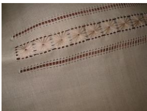
Artesano: Antonio Calderón Producto: Camisas

Se percibió en la artesana la intención de enriquecer el producto con motivos y patrones en secuencia, a través de la técnica del nudo. Se planteó la conveniencia de simplificar formas y la necesidad de aportar funcionalidad al producto con una mezcla de otro tipo de material. Igualmente, se propuso disminuir la saturación y cantidad de color de las superficies y usar menos elementos en las composiciones.