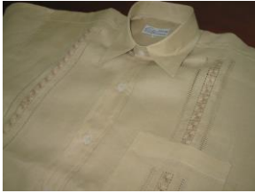
Artesano: Eliseo Gutierrez Producto: Camisas

Productos para caballeros tradicionales, siendo éste su mercado objetivo. Se planteó la posibilidad de buscar mercados juveniles, a través de diseños más acorde con las tendencias de la moda y con apariencia más comercial. Se planteó el uso del color, se enfatizó mucho sobre la manera y la importancia de la confección como componente de diseño y, a su vez, sobre la necesidad de buscar nuevos mercados con aplicación de las técnicas, bordados y calados, en productos diferentes al de moda.