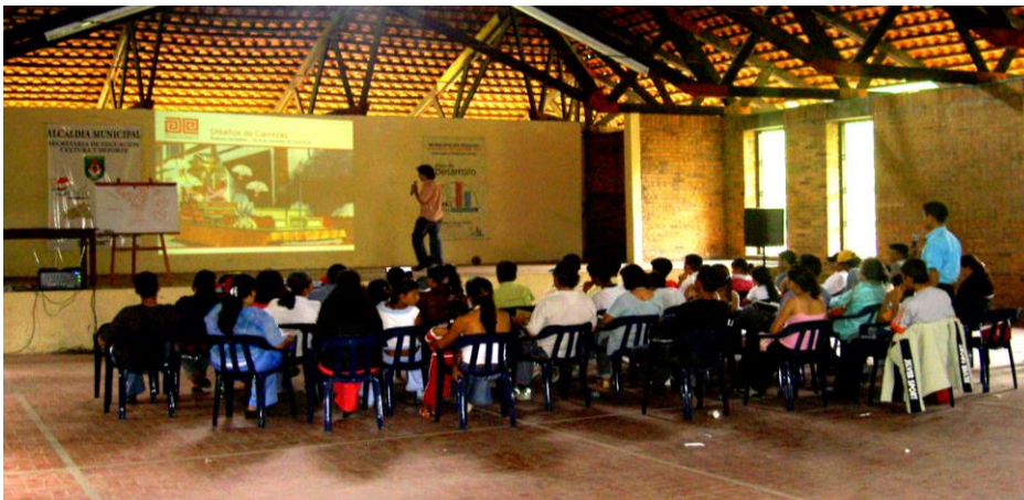
Conceptualización en los criterios para el desarrollo de nuevas propuestas de diseño de carrozas