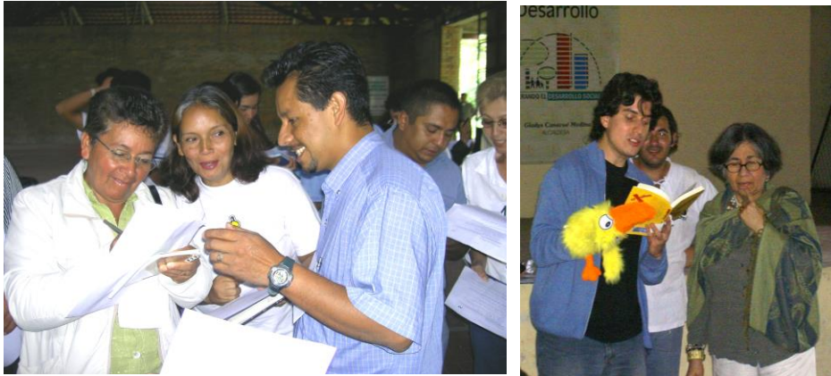
Actividad de Integración. Reconocimiento de Expectativas y de Referentes socio-culturales.