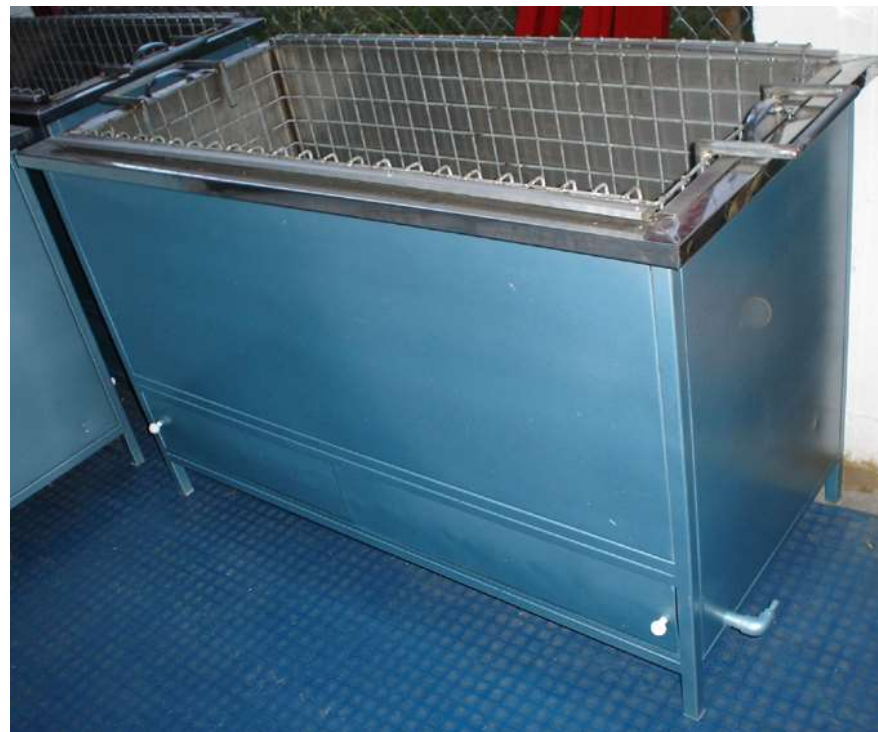
Sistema implementado en Sandoná Caldera a gas