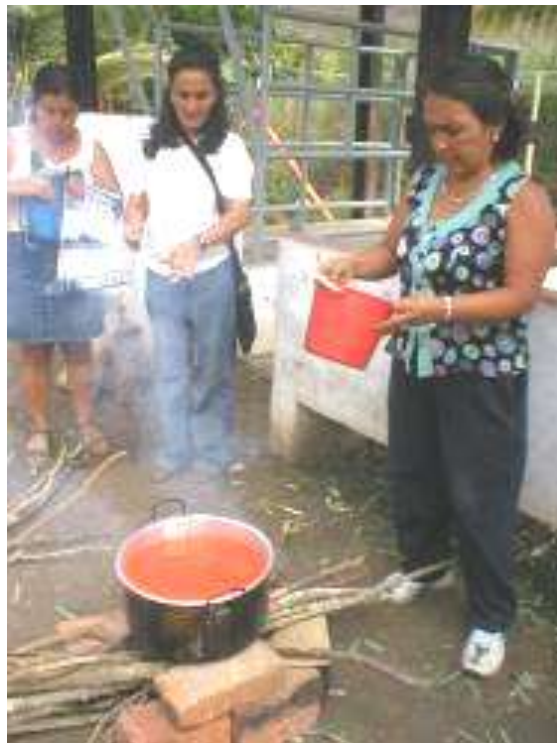
Sistema tradicional - leña