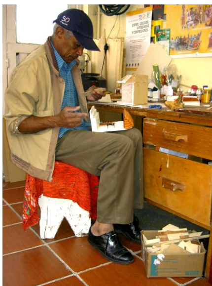
Puesto de trabajo, localidad de Fontibón