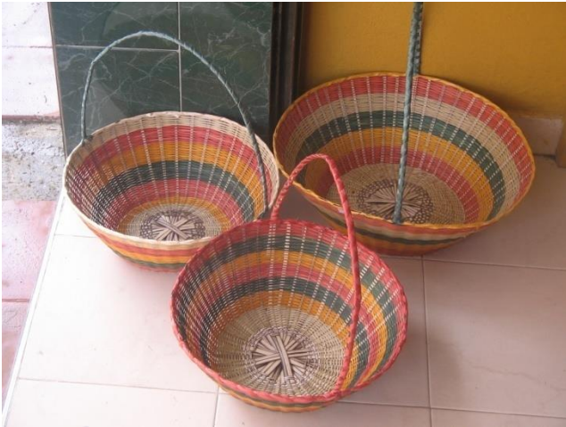
•MATAMBA Y AMARGO