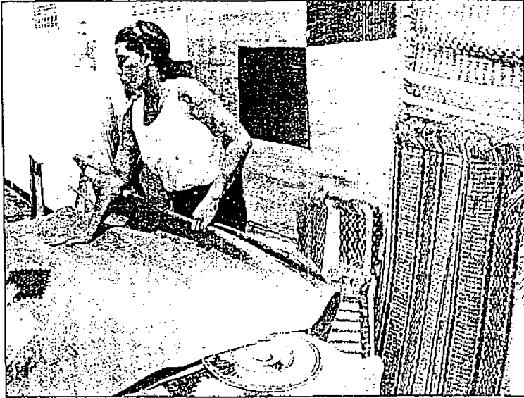
LAS ARTESANAS DE la palma de estera trabajan para lograr la máxima calidad en sus productos, los cuales han logrado ubicarse en países como Venezuela, Panamá y Estados Unidos, entre otros.

Una de las alternativas propuestas es la habilitación de un espacio en el cruce de cuatro vías en Chiriguaná y en Pallitas, donde se proyecta un 'corredor turístico', donde tiene cabida la exhibición de los productos artesanales.