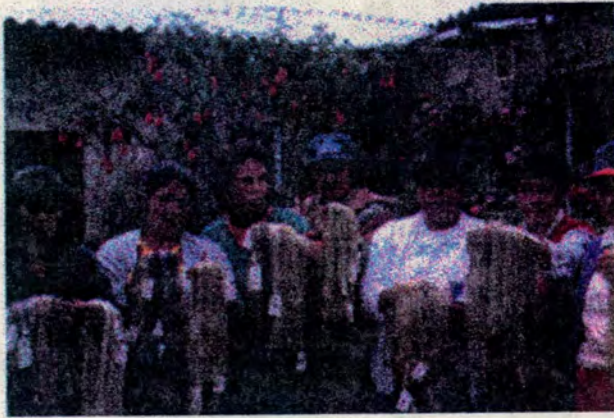
Arriba: taller de tintes, Timbiquí, Cauca. Mitad: Grupo de mujeres artesana de Tipacoque, Boyacá Abajo: Artesanas tejedoras de Cauca