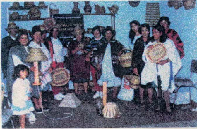
Abajo: artesana tejedora, cestería de rollo, Boyacá