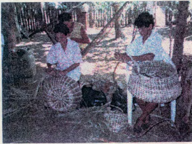
Arriba: Artesanos de Rabolargo, Córdoba