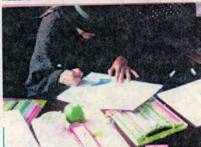
Arriba : Mujeres Indígenas de Guambía , Cauca Mitad : Cooperativa de Artesanas en Esparto, Cerinza, Boyacá Abajo: Artesana Boyacense