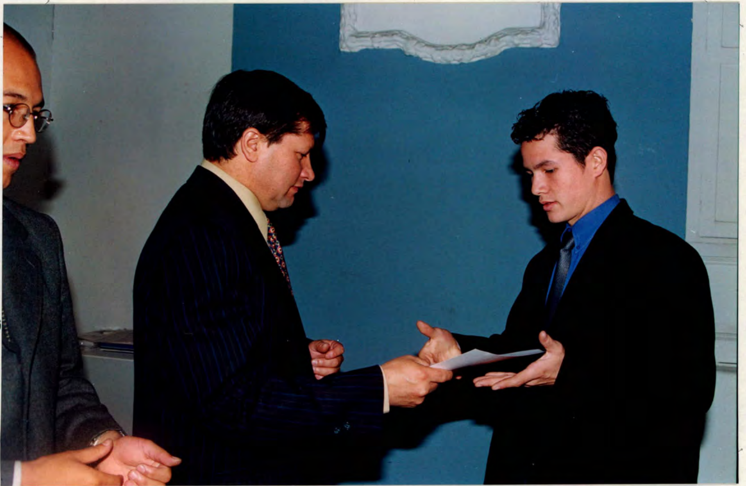
ANEXO IV ACTO DE CLAUSURA GRUPO DE LA TARDE