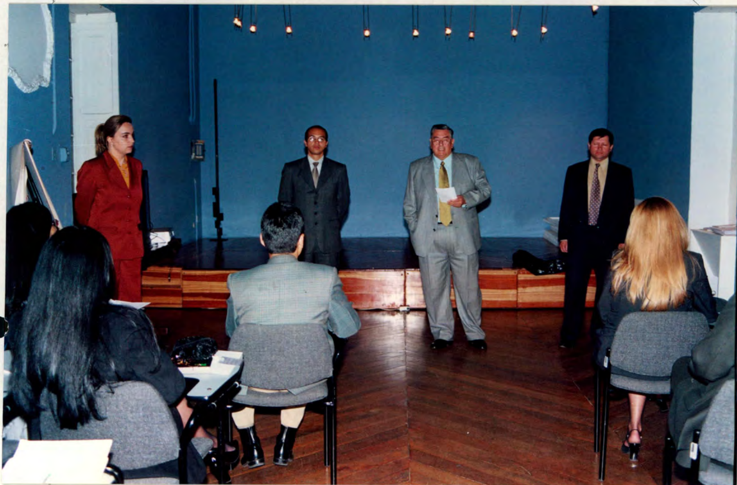
ANEXO IV ACTO DE CLAUSURA GRUPO DE LA TARDE