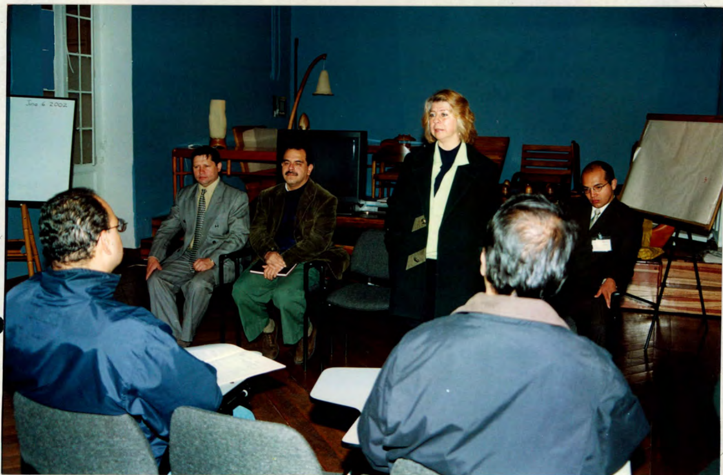
ANEXO III ACTO DE INAUGURACIÓN GRUPO MAÑANA