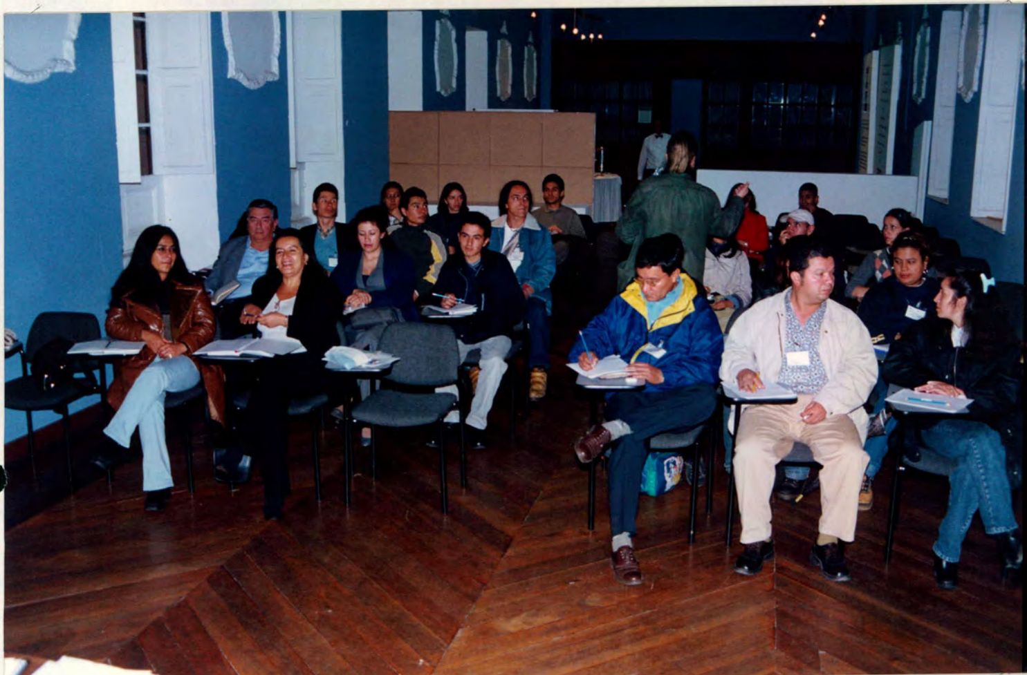
ANEXO IV ACTO DE INAUGURACION GRUPO DE LA TARDE