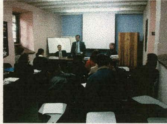
Taller "Programa de Entrenamiento para diseñadores"

En el marco de la Acción formativa No. 1 de Asesorías en Diseño para la Gestión del producto , la producción y la comercialización se realizaron las siguientes actividades: