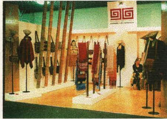
Stand Institucional Evento Bogotá Fashion 2002