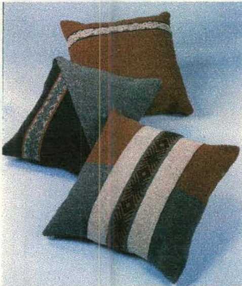
Cojines en lana Sibundoy - Putumayo

Se asesoraron los oficios de tejeduría, talla en madera, Bisutería y cestería; esto generó 1 línea de 12 productos.