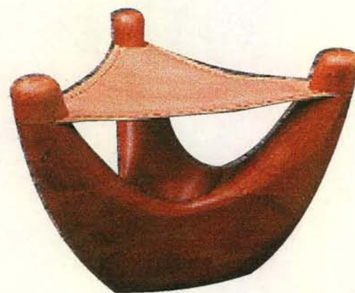
Muebles en madera Pasto - Nariño