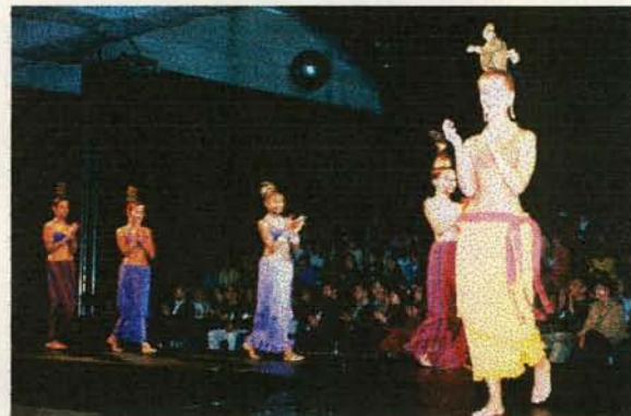
Telas en hilaza de algodón San Jacinto - Bolívar