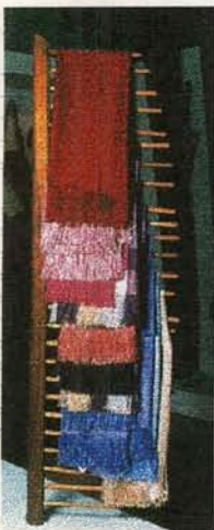
Chales en seda Timbio - Cauca

Se asesoraron los oficios de tejeduría y cestería; esto generó 5 líneas de productos.