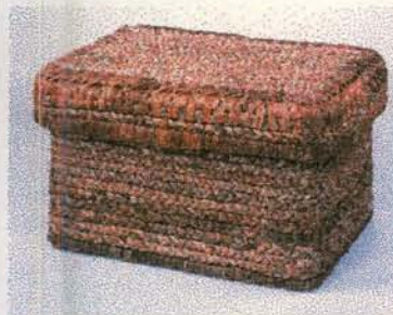
Productos en calceta de plátano Turbo - Antioquia