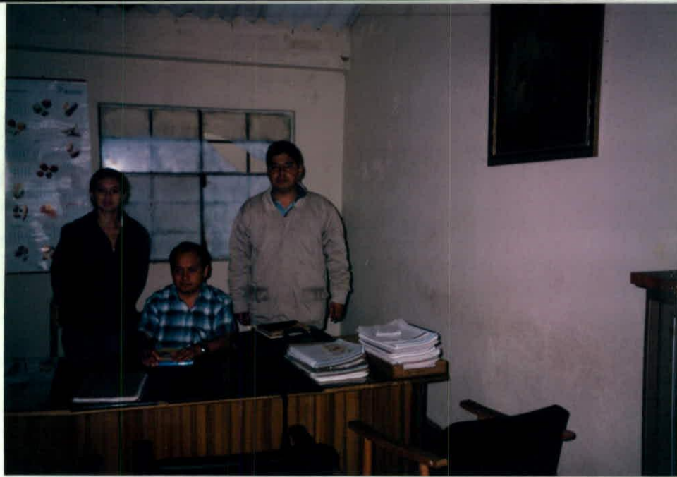
ALCADE DE GÉNOVA