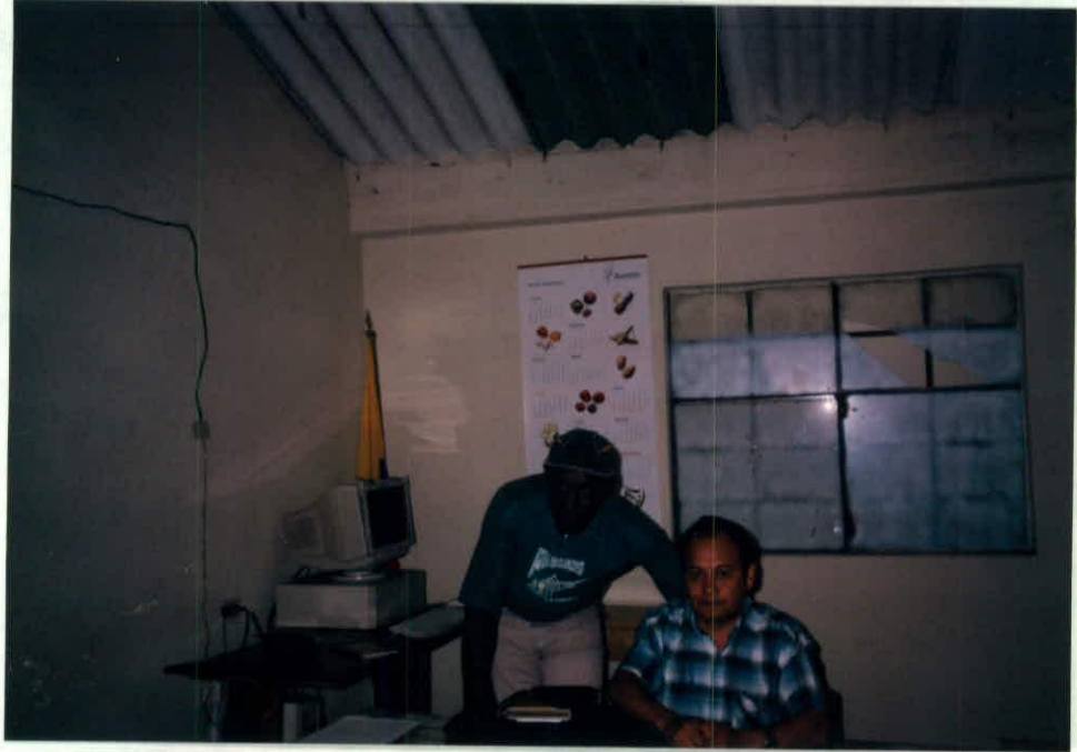
ALCADE DE GÉNOVA COORDINADOR DE LA UMATA